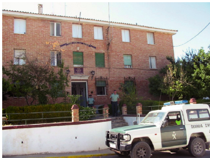
Lam. 3. La actual casa-cuartel, calle de las Seras