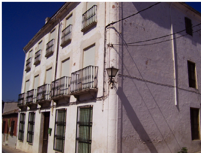
Lam. 11. Puesto de El Cañuelo (calle Llana, junto a la plaza Capitán Cortés.)