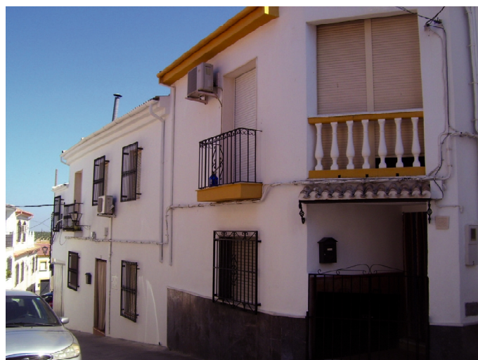
Lam.9. Puesto de Castil de Campos (en la calle Fuente-Tójar.)

Otros nombres nos han llegado debido a las intervenciones (por infracciones contra la Ley en diversos asuntos) llevadas a cabo por los guardias de los Puestos de Fuente-Tójar y de las poblaciones limítrofes de Castil de Campos, El Cañuelo y Zamoranos 27 .