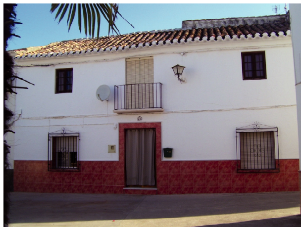
Lam. 12. Puesto de Zamoranos (calle Antonio Ruiz.)