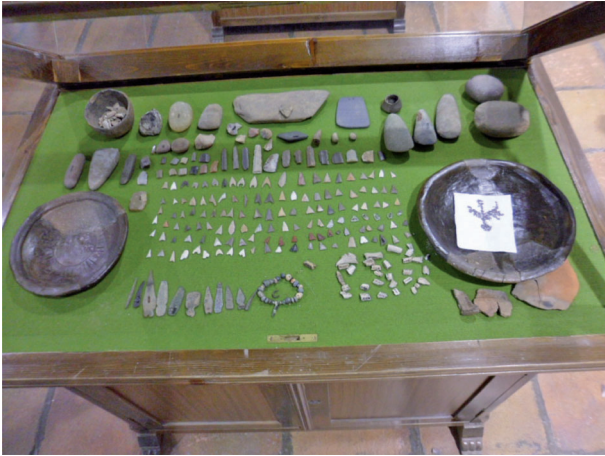
Ajuar funerario de Minguillo IV junto a otras piezas del mismo periodo (Vva. de Córdoba)

do unos, cazando otros, laboreando los filones cupríferos superficiales que afloraban en los monteras de los cerros y, otros roturando la tierra con azadas de piedra y preparando las tierras para la siembra anual del trigo, cebada, habas, etc.