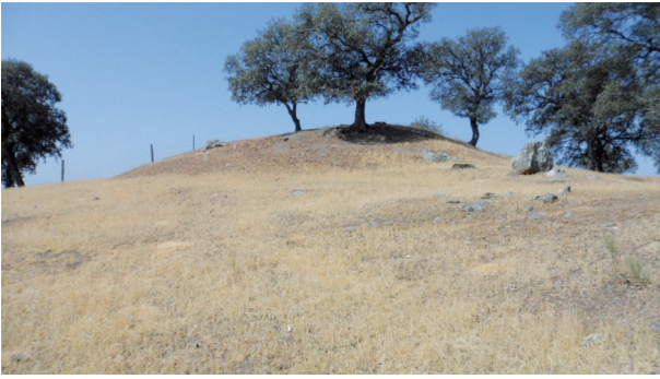
Dolmen de san Gregorio (Conquista) visto desde el este