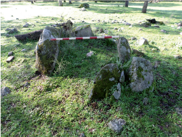
Dolmen: ESTERCOLADOS ( Conquista).

En un cerrito inmediatamente situado al este aparece gran cantidad de cuarzo fracturado, de que con profusión tiene la estructura tumular.