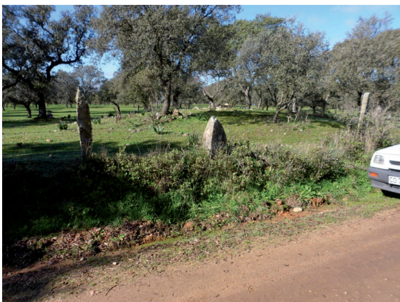
Dolmen: LAS MOZAS I (Conquista).

Está situada en llano y se orienta al este.