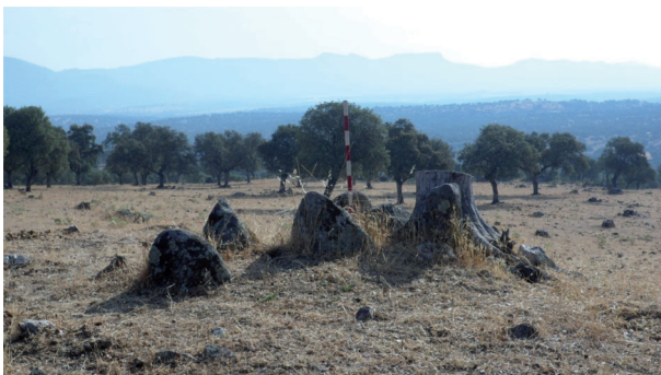
Dolmen: Tejoneras I (Conquista) visto desde el lado sur.

Se enclava en un magnífico otero desde donde se divisa por el norte un vasta zona de Sierra Madrona, por el este y el sur podemos contemplar todo el valle por donde discurre el arroyo Pedro Moro, en este lugar aparecen infinidad de afloramientos graníticos, su altura sobre el nivel del mar es de 661 metros.