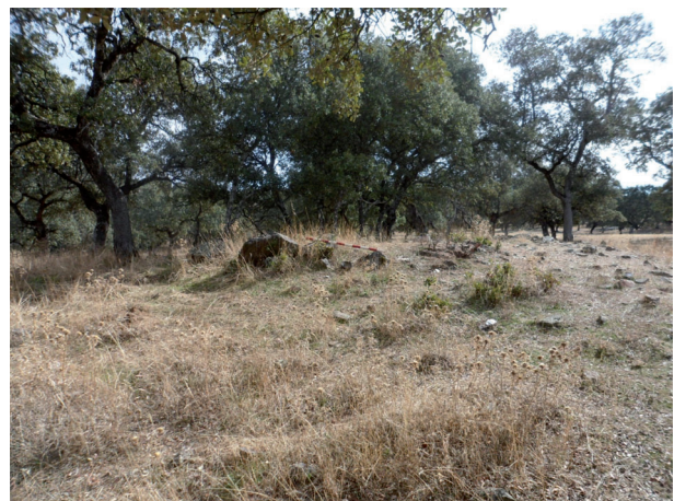
Dolmen: LAS MOZAS II. (Conquista).