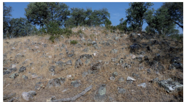
Dolmen: TEJONERAS II (Conquista). Estructura tumular.