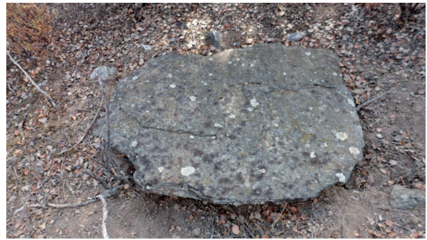
Dolmen de Nava Grande (Conquista) ¿Piedra de cubierta?