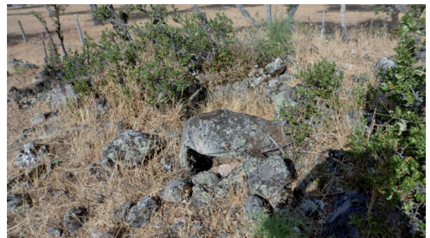
Dolmen: Tejoneras II (Conquista). Cámara funeraria

Posee una cámara funeraria formada por varios ortostatos, pero aparece cegada por piedras y no acaba de dejarse ver, porque parte de ella la ocupa una gran piedra de 1,10x1,00x0,35 metros que podría pertenecer a una parte de la cubierta, el diámetro de la estructura tumular es de 18 metros; tiene una alzada aproximada de 1,80 metros de cuarzo blanco grisáceo, la cámara por el contrario es de granito gris y mide 1,90x0,90x1,90 metros; la altura sobre el nivel del mar es de 656 metros. Se localiza a unos 150 metros al norte de Tejoneras I.