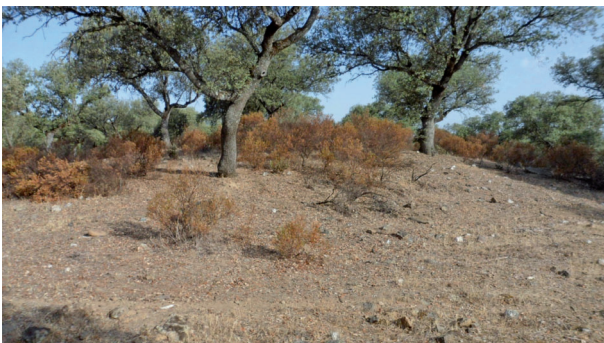
Dolmen de Nava Grande (Conquista) visto desde el lado este.

Mide esta estructura tumular 20 metros de diámetro y se alza sobre el territorio aproximadamente 1,80 metros estando casi toda ella cubierta por jaguarzos, sobre la estructura tumular se aprecian diversas piedras medianas, entre ellas distinguimos una plana que pudo haber servido de ¿cubierta?. Mide 1,00x0,90x0,10 metros; no se aprecian ortostatos y la estructura tumular está compuesta por pequeñas piedras y tierras compactadas, por el sureste aparecen muchos nódulos pequeños de cuarzo blanco, este túmulo está situado a 40 metros a la izquierda del camino y no ofrece obstáculo alguno hasta el mismo, la altitud sobre el nivel del mar es de 666 metros.