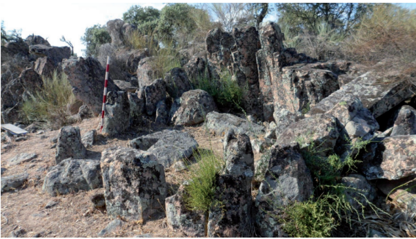
Tholos: Cañada Morena II (Conquista). Visto desde el lado sur

pasillo o corredor muy corto está orientado exactamente al este, sobre el que cae un gran piedra que mide 1,60x0,60x0,50 metros, la cámara funeraria tiene 3,30 metros de luz, apoyándose en una estructura tumular de piedras y tierra compactada de 7 metros; hasta el interior de la cámara y a una altura aproximada de 1,30 metros, carece de cubierta y la altura sobre el nivel del mar es de 666 metros.