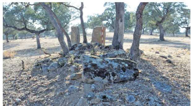
Dolmen de Cañada Morena I (Conquista).

Está ubicado en una pequeña loma desde donde se divisa por el norte Cañada Morena II. Posee parte de la estructura tumular, que aparece en forma oval, debido a acercarse por el este y oeste los arados, mide en el eje norte-sur 7,50 metros y en el este-oeste 0,6 metros, conserva erigidos dos ortostatos que se localizan el uno en el oeste y mide 0,90x0,40x0,30 metros; el otro en el sur mide 0,90x0,50x0,30 metros. Al pie de los mismos hay una gran piedra de 1,10x0,30x0,15 metros. Dos piedras más hay en la cercanía, la primera mide 1,30x0,25 metros y la segunda está apoyada en la estructura tumular por la zona este y mide 1,10x0,80x0,30 metros, conserva la estructura tumular una alzada aproximadamente de 0,70 metros, desde este lugar y mirando al norte se ve Sierra Madrona; la altura sobre el nivel del mar es de 676 metros. Encima el túmulo crecen cinco pequeñas encinas.