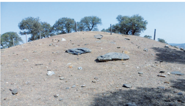
Dolmen de san Gregorio (Conquista) visto desde el sur