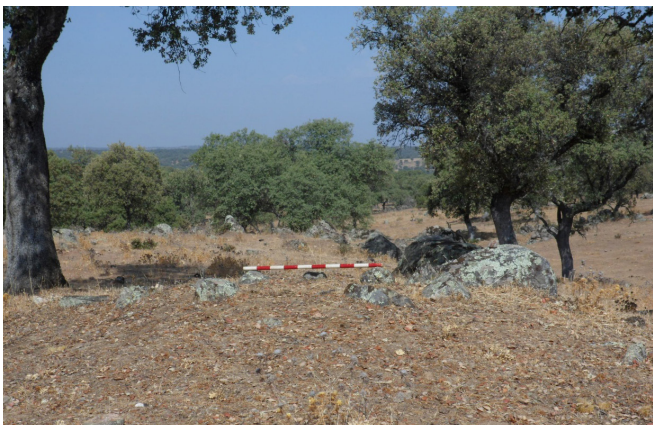
Túmulo Torrubia II

Nº 29. MUNICIPIO: CARDEÑA. TOPÓNIMO: TORRUBIA II. DATOS CARTOGRÁFICOS: HOJA Nº 882 ESCALA 1-50000 CARDEÑA I.G.N. COORDENADAS: X= 373796 Y=4247817 Z=657. ACCESOS: Desde Cardeña marcharemos por la carretera A-3200 que une Azuel con Conquista, circularemos por ella hasta el caserío de Torrubia que lo sobrepasamos, para a 500 m. aproximados veremos a la izquierda un viejo camino que se dirigía al caserío de la propiedad, por el que no se puede circular porque está cortado por la alambrada que da a la carretera; la pared izquierda es de piedra y la derecha de alambre de espino; el dolmen se encuentra situado a 300m. al O. del anterior.