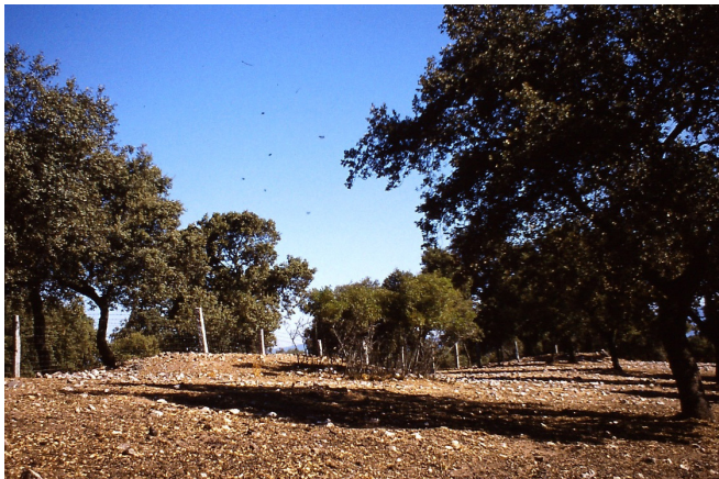
Dehesa Navalaborrica IV

Nº 11 MUNICIPIO: CARDEÑA. TOPÓNIMO: NAVALABORRICA IV. DATOS CARTOGRÁFICOS: HOJA Nº882 ESCALA 1-50000 CARDEÑA I.G.N. COORDENADAS: XUTM= 387696 YUTM= 4240161 Z= 769. ACCESOS: salimos de Cardeña desde la rotonda hacia el N.O., por el camino que va al cortijo de Piedra Empinada el que pasamos; continuamos y cruzamos el camino que desde Azuel se dirige a la Venta del Cerezo, continuamos hasta un poco antes de llegar al cortijo de La Gabia, desde la alambrada del camino sale otra por la derecha por el interior de la finca, la que seguimos hasta encontrar a nuestra izquierda otra de malla cinégetica, que arranca de ella; ahí lo podemos ver sobre antiguas labores de minería.