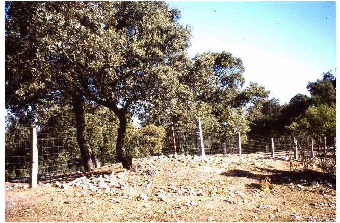
Dolmen Navalaborrica II

ESTRUCTURA: esta construcción se encuentra desmantelada, fue construida sobre un filón cuarcífero, que sufrió laboreo minero en el período Calcolítico; presenta en superficie 3 ortostatos que aparecen fuera de contexto, uno de ellos parece ser de piedra de mina y los otros dos de granito; el diámetro de la estructura es de 7 m., en la que crece por el N.O. de la misma una encina; está situado en alto y se orienta al S.E.; el uso del terreno está dedicado a explotación ganadera.