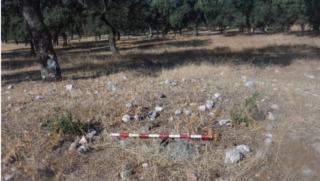
Dolmen Navalaborrica I

pequeño cono aflora lo que parece ser un ortostato de granito gris, presumiblemente perteneció a la cámara funeraria; mide 0.90x0.10 metros y aflora en superficie 0,15 m; está situado en vertiente y se orienta al S.E.; este terreno tiene buen encinar, está dedicado a explotación ganadera.