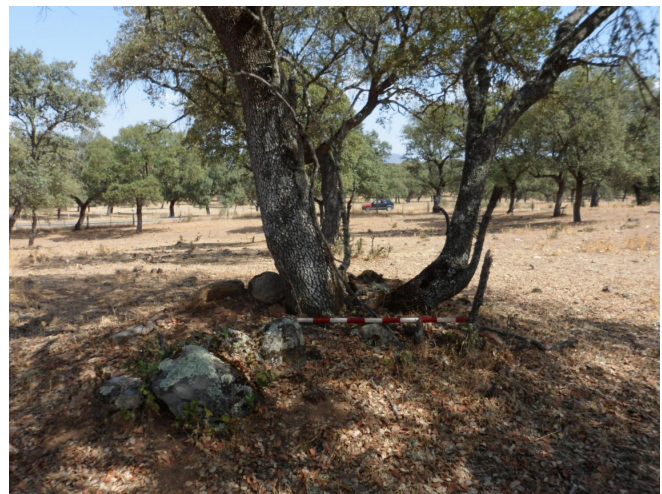
Dolmen Torrubia III

Nº3 MUNICIPIO: CARDEÑA. TOPÓNIMO: TORRUBIA III. DATOS CARTOGRÁFICOS: Hoja Nº 860 ESCALA 1-50000 FUENCALIENTE I.G.N. COORDENADAS: XUTM: 373580 YUTM=4248066 Z= 641. ACCESOS: Desde Conquista circularemos por la A-3200, que une Conquista con Azuel; una vez rebasado el Arroyo Pedro Moro, que limita Conquista de Cardeña, continuaremos un pequeño trecho, hasta un pequeño regajo que cruza la carretera por un puente de un ojo, situado a la derecha de la marcha; seguimos ya en el interior de la propiedad aguas arriba, y más o menos 100 m al N.E. y a unos 70 m. de la carretera lo veremos situado en la margen izquierda del pequeño arroyo y orientado al O.