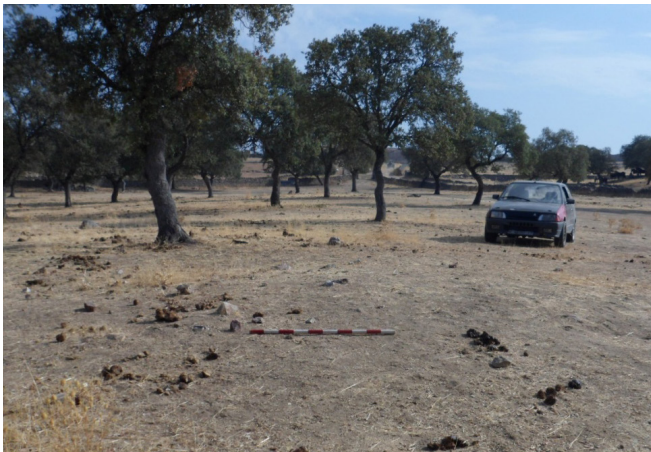
Dolmen Torrubia IV

N°4 MUNICIPIO: CARDEÑA. TOPÓNIMO: TORRUBIA IV. DATOS CARTOGRÁFICOS: HOJA N° 860 ESCALA 1-50000. FUENCALIENTE I.G.N. COORDENADAS: XUTM= 374185 YUTM=4246651 Z= 651. ACCESOS: Circulamos por la A-3200 Azuel -Conquista hasta el cortijo de Torrubia, donde aparece un camino a la izquierda; circulamos por él 150 m. donde se bifurca; este es el camino a Fuencaliente, y el de la izquierda el de Torrubia a Navalazarza; los portones de acceso a esta propiedad están situados en el mismo vértice de la unión de los dos caminos, desde este lugar veremos a 150m. al S.O. la pequeña estructura que de el queda; esta propiedad esta vallada con cercado de piedra.