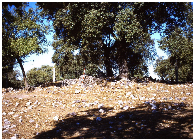
Dolmen Navalaborrica III

Nº 10 MUNICIPIO: CARDEÑA. TOPÓNIMO: NAVA DE LA BORRICA III. DATOS CARTOGRÁFICOS: HOJA Nº882 ESCALA 1-50000 CARDEÑA I.G.N. COORDENADAS: XUTM= 387686 YUTM= 4240126 Z=774. ACESOS: salimos de Cardeña desde la rotonda hacia el N.O., por el camino que va al cortijo de Piedra Empinada que pasamos; continuamos y cruzamos el camino que de Azuel se dirige a la Venta del Cerezo, continuamos hasta un poco antes de llegar al cortijo de La Gabia, donde desde la alambrada del camino sale otra por la derecha por el interior de la finca, la seguimos hasta encontrar a nuestra izquierda otra de malla cinegética, que arranca de ella; ahí lo podemos ver sobre antiguas labores de minería, y el IV lo veremos a continuación algunas decenas de metros al N.E. sobre las mismas labores mineras.