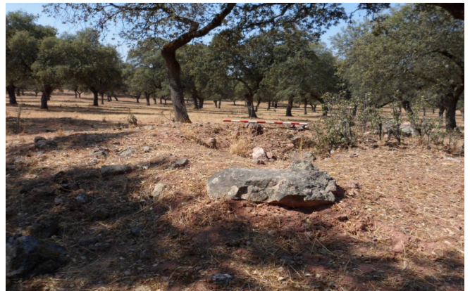
Túmulo Eneal

Nº 27. MUNICIPIO: CARDEÑA. TOPÓNIMO: ENEAL. DATOS CARTOGRÁFICOS: HOJA Nº 882 ESCALA 1-50000 CARDEÑA I.G.N. COORDENADAS: X=370186 Y=4241442 Z= 720. ACCESOS: desde Cardeña circulamos por la A-424 dirección Vva. de Córdoba, hasta el camino que desde Navalazarza se dirige a Torrubia, el que cogeremos a la derecha nada más pasado el Km. 16, y desde ahí circulamos 1.450 m., y veremos a la izquierda del camino y a 20 m. de la alambrada el cono tumular.