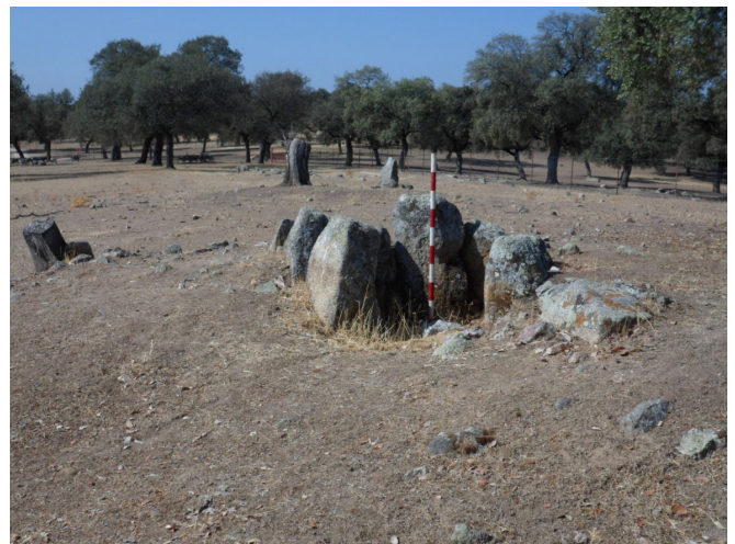
Dolmen Torrubia V

Moro veremos dos portones unos a la derecha y otros a la izquierda, cogemos por los de la derecha que accede al caserío de la finca de Tejoneras, este camino es público que seguiremos y rebasaremos el cortijo, más adelante giramos a la izquierda cruzando el arroyo Pedro Moro; al poco encontraremos una cancela colocada en el suelo; siguiendo ese camino llamado de La Loma del Fresco que discurre por medio de propiedades sin vallar durante 1100 m. llegamos al dolmen que aparece a la izquierda del camino; esta construcción está cercana al caserío propiedad de la familia Martos de Vva. de Córdoba, es territorio de encinas, se sitúa a 3 m. del camino y a 200 m. del camino de Fuencaliente.