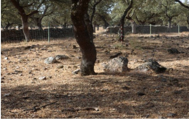
Túmulo Torrubia I

dando de ella el estratificado de tierra y piedras muy removidas que forman un montón muy desparramado sobre el terreno; se advierten dos ortostatos que afloran 20 cm. uno y 10 el otro; tuvo un diámetro de 16 m. y su alzada es mínima. Se ubica en dehesa de encinas sobre una pequeña lomita, y su orientación lo hace al N.; está dedicado a explotación ganadera y se valla con piquetes y alambre de espino.