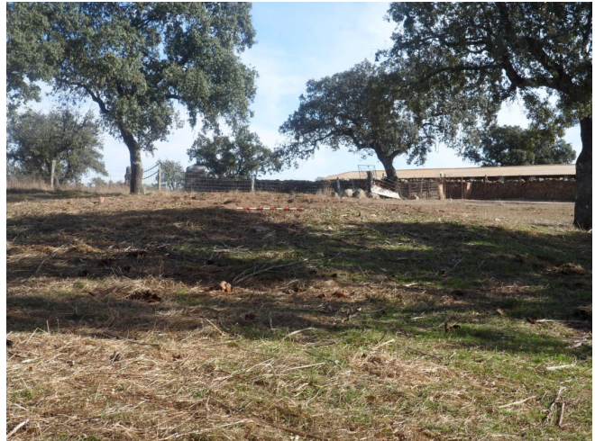
Dolmen Dehesa del Rey

ESTRUCTURA: Sólo queda de él un montón de tierras y pequeñas piedras, tiene un diámetro de 12 m. y una altura de 0,80 m., a 50 m al N. aparecen varias grandes piedras que creemos pudieron haber pertenecido a la estructura dolménica; se ubica en alto, su orientación es N.E., y se instala en terreno adhesionado de encinar y vallado por paredes de piedra (en el lugar que se ubica no existe pared); las causas de su deterioro es debido a la extracción de piedra para la construcción de vallados o caseríos de la propiedad.