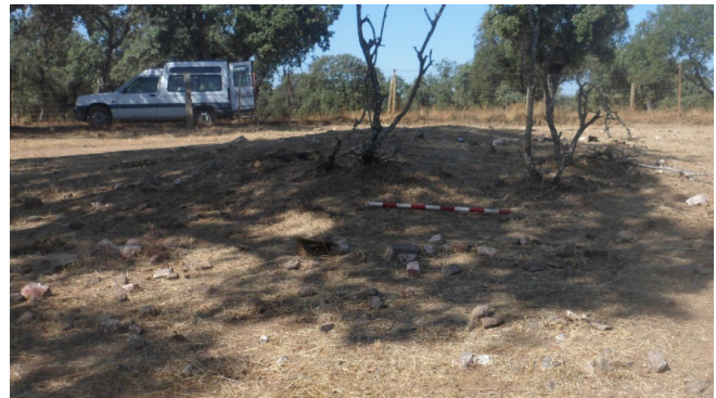
Dolmen Charneca

recha, y una vez transcurridos 600 m. aproximadamente, veremos a la izquierda y en el interior de la propiedad y a 5m. de la alambrada el dolmen, o de lo que el queda.