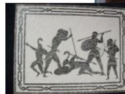
L5- Teseo contra Los Palántidas 0.80x0.60 m.