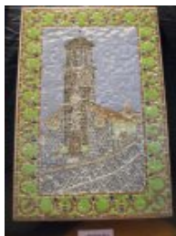
L1- Torre «Parroquia San Miguel» 0.68x0.58m