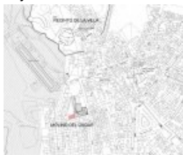
Fig. 1 Plano de situación de la intervención.

El solar se localiza entre la C/ Molinos y C/ Nueva, en la manzana 34357, parcela 02, de las Normas Subsidiarias de Aguilar de la Frontera. El acceso actual se realiza por una servidumbre de paso en la C/ Doña María Coronel. Se trata de un solar vacío que se encuentra en el lado oeste del edificio del Molino del Duque, que anteriormente contuvo estructuras edilicias pertenecientes al conjunto del molino.