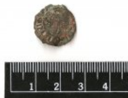
Fig. 6 Anverso

Reverso: (REX ET REGINA CA)ST:LEGI(ON). Figura coronada contenida en un círculo de puntos.