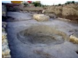
Fig. 4. Interfaz de una antigua piedra de moler. en segundo término, cimentación de los pilares del edificio del molino

Fig. 4. Interfaz de una antigua piedra de moler, en segundo término cimentación de los pilares del edificio del molino.