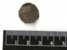
Fig. 6 Reverso