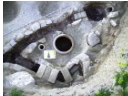
Fig. 3. Vista cenital de la tinaja de decantación y los canales de servicio.