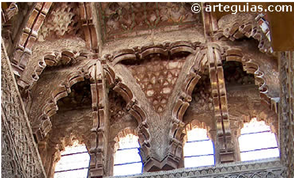
La Arquitectura mudéjar civil en Córdoba

Los arcos son lobulados de tradición almohade. Los espacios que dejan los arcos al cruzarse llevan mocárabes policromados como decoración. En la parte del arranque de los arcos hay preciosos vanos polilobulados para la iluminación.