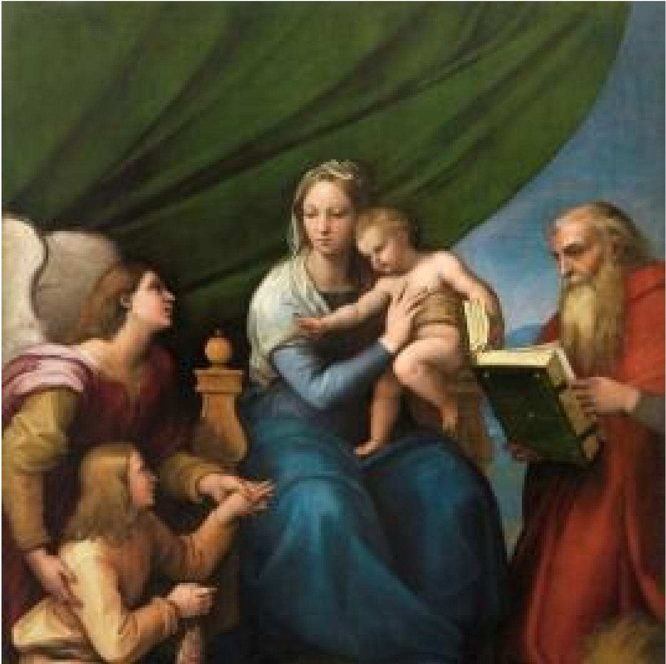
Sagrada Familia con Rafael, Tobías y San Jerónimo, o Virgen del pez

Óleo sobre tabla pasada a lienzo. 1513 - 1514