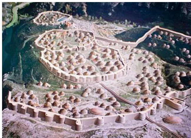
Los Millares en su momento de apogeo

Se ha establecido hasta cuatro fases evolutivas: En Millares I, se construyó el poblado y tres lienzos de murallas con torreones y una entrada monumental. Millares II: se levantó otra muralla y los fortines externos, mientras aumentaba la población y se dismanteló una muralla interna. Millares IIb: aparece en los ajuares el vaso campaniforme. Millares III: se abandonaron las murallas externas y los fortines, reduciéndose la población a los ocupantes de la ciudadela, para, al final del periodo, dejar también ésta.