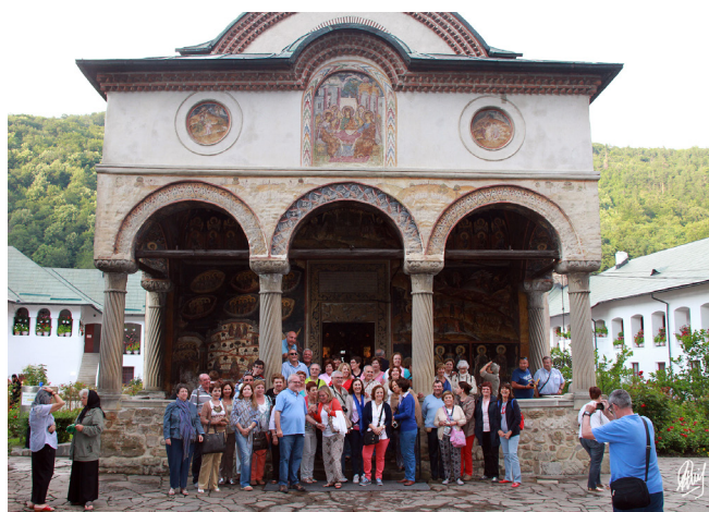
Monasterio de Cozia

Una vez finalizada la comida pusimos rumbo a Sibiu. Durante el trayecto tuvimos ocasión de conocer el aspecto menos positivo del viaje: las vías de comunicación. No hay autopistas ni autovías y los tiempos estimados por trayecto fácilmente se duplican. También es verdad que tienes más tiempo para observar el impresionante paisaje, ya en las estribaciones de las Cárpatos Meridionales hicimos una parada en el Monasterio de Cozia. Situado en el desfiladero del río Olt, todavía en Valaquia, es uno de los monumentos más valiosos de la arquitectura del siglo de XIV y punto de referencia del estilo bizantino. La iglesia principal impresiona por la armonía de sus proporciones y por una ornamentación rica con pinturas de un valor incalculable.