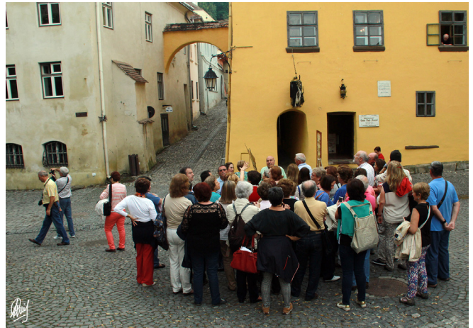
Casa Vlad Dracul

Después de pernoctar en el Hotel Cavaler, volvimos al día siguiente a La Ciudadela y esta vez sí subimos a la Torre del Reloj y de nuevo nos maravillamos con las vistas que desde allí contemplábamos, mirando hacia cualquiera de los cuatro puntos cardinales. Antes vimos una imagen que al menos a mí me sorprendió un poco: una Loba Capitolina erigida sobre una gran pedestal: “Alla cită di Sighisoara. Roma madre”. Me acordé de La Dacia y de las guerras que Trajano mantuvo en estos territorios y dónde dejó enterrado a su gran amigo Longino. Acudieron a mi mente personajes como Decéballo, ciudades como Sarmizegetusa, aquí en la misma Transilvania, tan cerca y tan lejos. Sigo sin explicarme y me apena y siento algo de bochorno el ver que Córdoba, la romanizada “Colonia Patricia”, tan ignorada por nosotros mismos, sigue adoleciendo de un monumento como este.