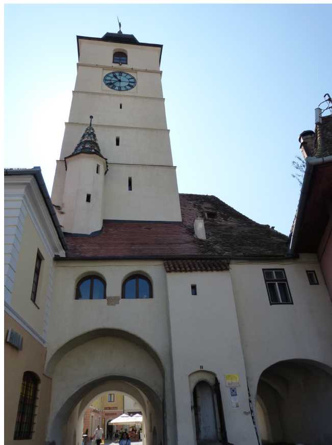
Turnul Sfatului, Sibiu

Todavía nos quedaba ver algo más en Sibiu. Teniendo en cuenta que ha sido una de las más importantes ciudades amuralladas del sureste de Europa, quedan todavía restos de las mismas y bastiones como los muy bien conservados que admiramos en la Strada Cetăți. De nuevo nos pusimos en ruta y en poco tiempo estuvimos en Sibiel, pequeña población rural que se permite albergar la colección de iconos sobre vidrio más grande de Europa. Tras visitarla almorzamos en una especie de granja donde colaboraba en el servicio todos los miembros de la familia y la verdad es que fue una experiencia muy agradable.