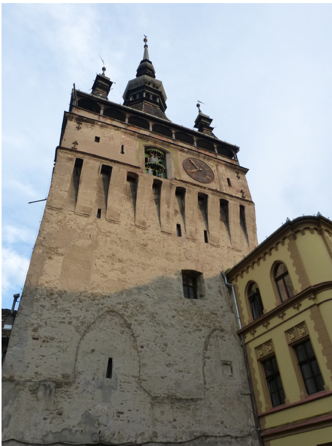
Turnul cu Ceas

Pero Sighisoara tenía mucho más, su Ayuntamiento del S. XIX pero con una mezcla adorable de estilos neoclásico y neogótico. Desde su entorno, se divisaba casi toda la ciudad atravesada por el río Târnava. Desde la Piata Cetății se puede subir por una escalera de 175 escalones y cubierta de listones de madera conocida como Strada Scollii, a la iglesia gótica Bergkirche, con un interior rico en frescos. Otros lugares interesantes eran la Turnul Croitorilor, puerta que daba entrada a La Ciudadela y la Catedral Ortodoxa de la Santísima Trinidad, ya al otro lado del río.