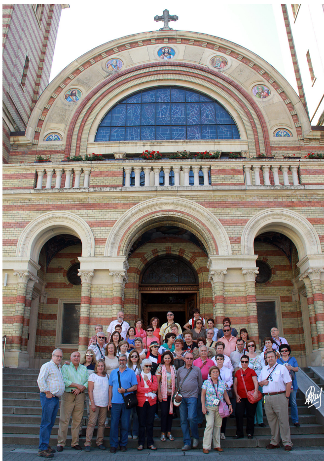
Catedral Ortodoxa Santísima trinidad

Tras descansar en un fabuloso Hotel Hilton nos encontramos con un día luminoso y sin pérdida de tiempo nos dispusimos a conocer la ciudad que por cierto fue Capital Europea de la Cultura en 2007. Lo primero que vimos fue la Catedral Ortodoxa de la Santísima Trinidad. Espléndida tanto por dentro como por fuera y construida tomando como modelo la Iglesia de Santa Sofía de Constantinopla, maravilla por su intensa policromía. Sus iconos de estilo bizantino, sus paredes pintadas con motivos religiosos en vibrantes colores y sus vidrieras, pocas, pero de gran fractura, merecieron una atenta mirada. El exterior es amarillo y rojo, además de sus torres, luce una magnífica cúpula