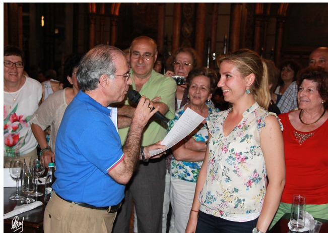
Bucarest. Caru cu Bere

La cena, muy bien servida, estuvo amenizada por parejas vestidas de etiqueta que nos deleitaron con bailes de salón, que acabó con una divertida participación de muchos compañeros de viaje. Al final a un ritmo acelerado de la Marcha Triunfal de Aida, desfilaron todos los camareros, cocineros y personal del restaurante acompañados por el toque de palmas de todos los asistentes. Fue una noche muy divertida.