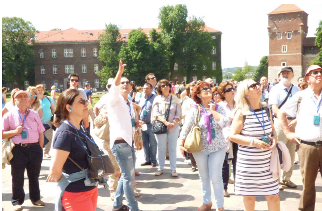
Observando la torre de la catedral

Aunque fue saqueada por las autoridades alemanas, Cracovia se mantuvo relativamente indemne hasta el final de la guerra, salvándose buena parte de su legado histórico. En 1978 la Unesco añadió por primera vez la ciudad vieja de Cracovia en la lista de sitios declarados Patrimonio de la Humanidad. Está dividido en tres zonas diferenciadas: la colina de Wawel, la ciudad medieval de Cracovia y el núcleo medieval de Kazimierz.