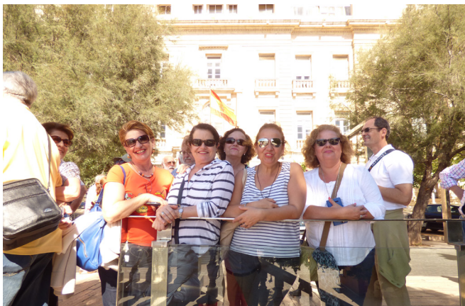
Descansando del guía

mos tenido ocasión de ver y disfrutar, nos retiramos a nuestro hotel y por fin descansar.