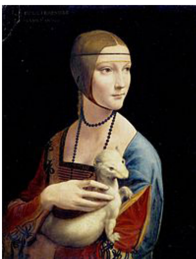
La dama del armiño de Miguel Ángel

Volvemos por la tarde y sacamos las entradas en grupo para visitar el castillo y el cuadro de la Dama del armiño de Miguel Ángel, se encuentra en el Museo Czartoryski de Cracovia.