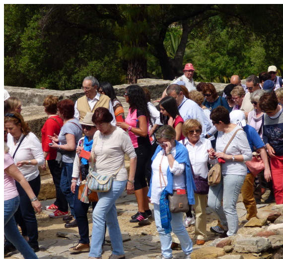
Paseando por el decumanus máximo

Conforme recorremos el yacimiento, la guía nos hable del abastecimiento de agua a la ciudad, que se realizaba por medio de tres acueductos, nos señala la zona industrial con restos de las instalaciones para la fabricación del garum . En ningún otro yacimiento romano de la Península Ibérica es posible extraer tras la visita una visión tan completa del urbanismo romano como en Baelo Claudia . En esto radica su principal interés, destacado también por el espectacular paisaje que rodea a la ciudad.