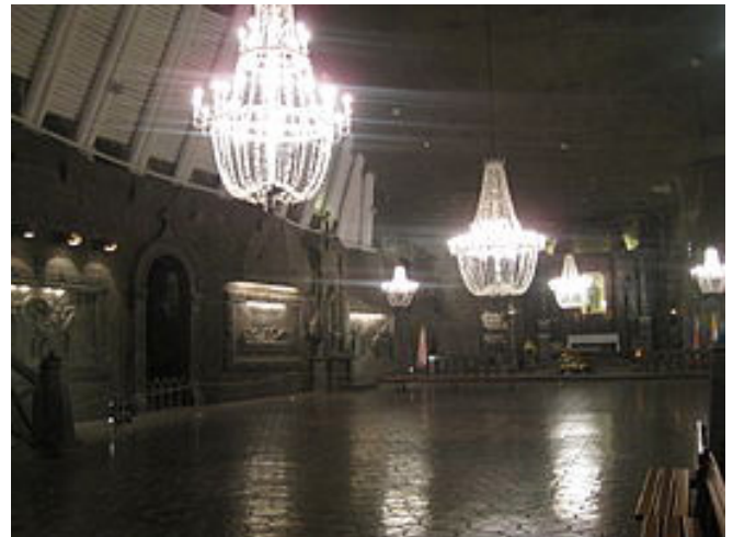
Capilla de San Kinga, en la profundidad de la mina de sal de Wieliczka.

Largos pasillos de sal llevan ya hasta los 135 m. de profundidad que marcan el final de la visita, situada en la sala más alta de la mina, 36 m. de altura.