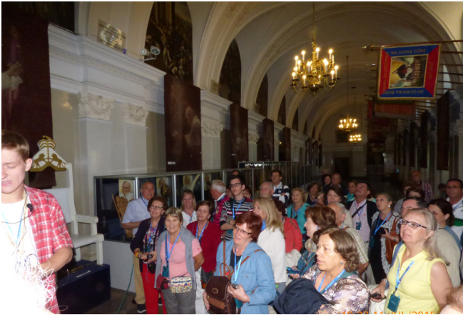
Con el guía en el interior del Santuario.

que ellos aplicaron dañaron áreas que deshizo la imagen (de acuerdo con el cronista medieval Risinius) y su solución fue borrar la imagen original y repintarla sobre la madera original, la cual se consideraba sagrada por su legendario origen como tablero de mesa de la casa de la Sagrada Familia .