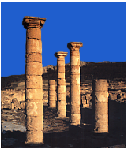
Columnas romanas de Baelo Claudia

maximus , que la cruza en ángulo recto y por tanto en dirección Norte a Sur. En el encuentro de estas dos calles principales se situaba el foro o plaza principal, cuyo pavimento actual es el original de losas de Tarifa conservado desde el siglo I, y a cuyo alrededor se distribuían los principales edificios públicos. Era esta una plaza descubierta con pórticos en tres de sus lados, desde uno de los cuales se accedía a tres de ellos: el templo del emperador, la curia , y otro que servía de sala de reuniones, es el edificio principal, situado al fondo es la basílica, destinado a diversos fines y especialmente a sede de los tribunales de justicia, en el lado izquierdo de él existían unas pequeñas construcciones rectangulares hechas con piedras: las tiendas o tabernae .