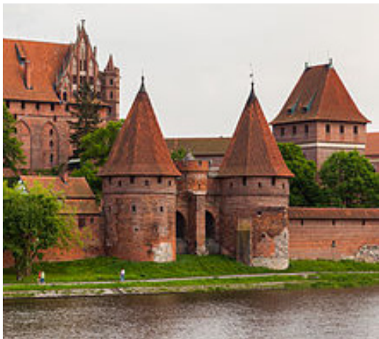
Puerta de entrada al castillo de Malbork

Nos dirigimos al Norte de Polonia, hacemos parada en el castillo de Malbork (castillo de María), construido por la Orden Teutónica como fortaleza militar medieval en el año 1274, es el castillo gótico más grande del mundo, construido con ladrillo en estilo gótico báltico, es impresionante; está situado en el margen derecho del río Nogat (afluente del Vístula). Fue sede de la Orden Teutónica en el siglo XIV, en él se celebraron muchas reuniones de la Liga Hanseática (asociación de ciudades comerciales).