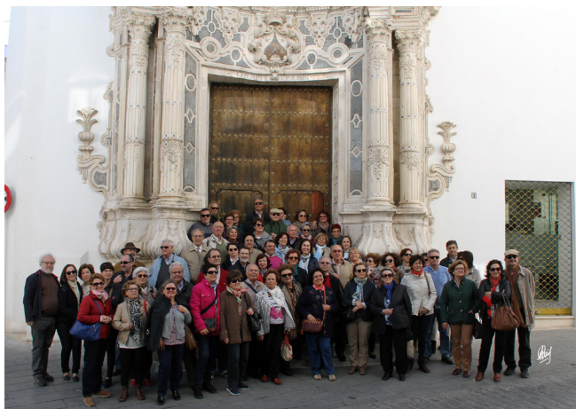
Visitando Estepa, sale hasta el fotógrafo Pedro Luis

No podemos olvidarnos de la visita al Museo Arqueológico Padre Martín Recio, en cuyo interior admiramos el importante fondo museográfico que acoge, constituido por multitud de piezas arqueológicas halladas en Estepa y su entorno, y que van desde el Paleolítico hasta la Edad Media. Proseguimos nuestro paseo rodeando la Iglesia de San Sebastián, construida sobre una antigua ermita y que muestra dos portadas muy diferentes en cuanto a su estilo y composición, la principal claramente renacentista, enmarca la puerta entre dos potentes contrafuertes de perfil cilíndrico de piedra labrada. La otra puerta está más elaborada, se abre en la nave de la Epístola y es de estilo barroco. Todo ello como consecuencia de la larga duración de su construcción que se prolongó desde el siglo XVI al siglo XVIII.