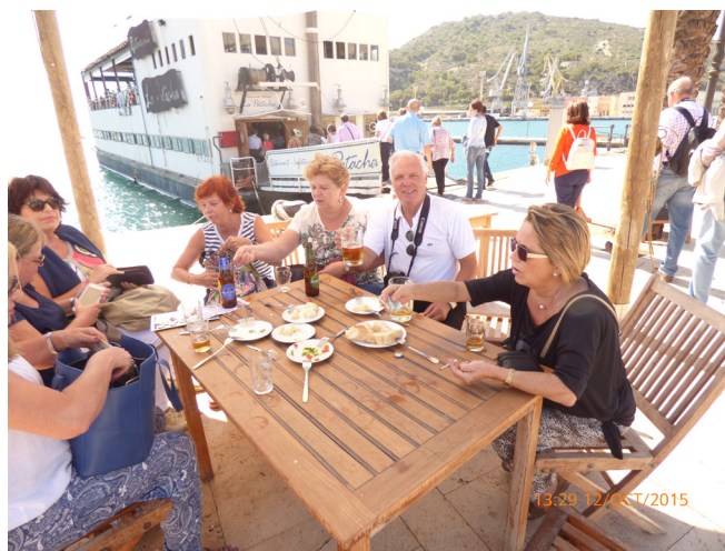
Reponiendo fuerzas, detrás restaurante La Patacha.

La jornada concluyó con un almuerzo muy marinero en un barco-restaurant, anclado en el puerto y que provocó el deleite de la mayoría de nosotros, salvo el de alguno que otro que se sintió levemente mareado, algo pasajero que pronto lo superaron y que no impidió el que todos acabáramos disfrutando del magnífico día. Tras la comida iniciamos el regreso a Córdoba, cansados pero satisfechos, con el recuerdo de aquella sorprendente ciudad que nos cautivó.