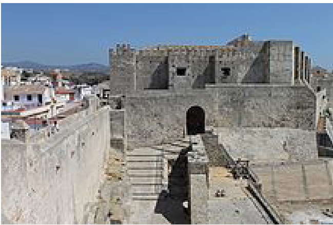
Alcázar desde el patio de Armas de Tarifa

El alojamiento lo tenemos en Algeciras y al día siguiente partimos para Arcos de la Frontera, para visitar el Centro de Interpretación, la Plaza del Cabildo, el Mirador de la Peña, la Basílica de Santa María de la Asunción, la Iglesia San Pedro Apóstol, el Jardín Andaluz, el Mirador de Abades y el Palacio del Mayorazgo. Almorzamos en el restaurante Peña de Arcos y a continuación nos volvemos a nuestro lugar de residencia, dirección Jerez de la Frontera y autovía de Sevilla.