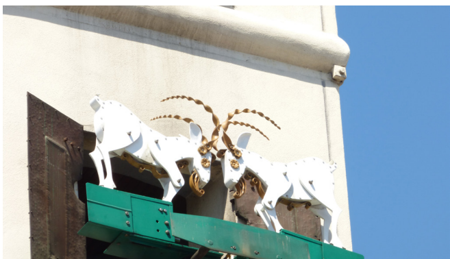
Torre del reloj, dos cabras, 12 topetazos marcan las horas