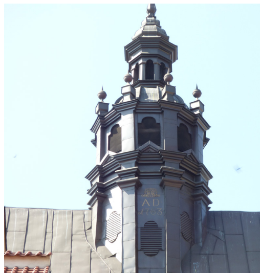
Torre del Ayuntamiento

La ciudad medieval amurallada de Cracovia ( Stare Miasto ) tiene una arquitectura muy rica, con bellos ejemplos de estilos renacentista, barroco y gótico. Las altas fortificaciones que la rodean fueron edificadas entre los siglos XII y XIV. La plaza del mercado ( Rynek Główny ), de 200 metros de lado, construida a mediados del siglo XIII, es la más grande de Europa. En su centro se encuentra el gran mercado de telas, edificio renacentista del siglo XIV ocupado en la actualidad por tiendas de recuerdos. En el lado este de la plaza destacan la Basílica de Santa María, Kościół Mariacki y la estatua de Adam Mickiewicz.