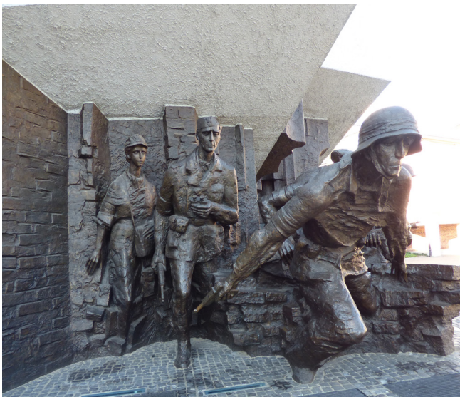
Monumento a la Insurrección de Varsovia

Se inicia la visita con fotos de la destrucción del castillo por los alemanes en la Segunda Guerra Mundial, a continuación en su recorrido vamos atravesando varias salas: de los Tapices , con esculturas y vasos enormes de mármol; Sala de Baile , cuya cúpula contiene frescos de luminosos y claros colores, candelabros y reloj; Sala de Mármol , con frescos de tema mitológico en la cúpula, pintura de Ladislao IV pintada por Marcello Bacciarelli; Sala de Senadores , Sala de las columnas , en el centro se encuentra el trono real; en otra sala se encuentra una constitución polaca, cuadros de historia y representaciones de Estanislao Poniatowski. La cena la hacemos en el hotel Westin a las 20,30 horas.