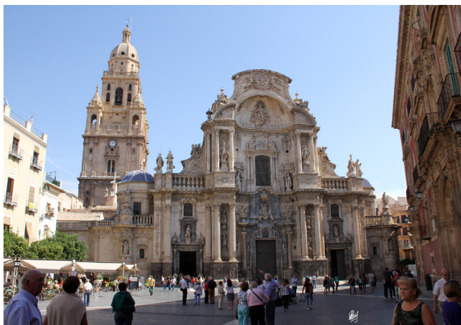
Catedral de Murcia

A través de la calle Arenal accedimos a la Plaza del Cardenal Belluga y aquí sí que el valor estético del conjunto arquitectónico que contemplamos era verdaderamente sobrecogedor destacando con mucho, la fachada de la catedral. Con sus 58 metros de altura es un auténtico retablo en piedra de estilo barroco repleto de imágenes armoniosamente distribuidas por todo este impresionante imahfronte.