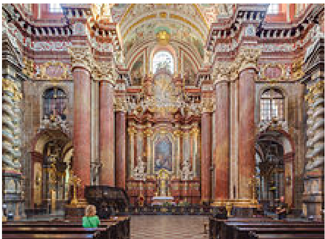
Iglesia colegial de los jesuitas en Poznan.

Iglesia de San Estanislao ( Kosciol Farny Sw. Stalislawa ), situada en la calle Ulika Klasztorna , número 11. Es una iglesia de estilo barroco construida por orden de los Jesuitas. De Junio a Septiembre se organizan conciertos gratuitos a las 12 horas y los sábados el resto del año. Entramos en ella, pero no tenemos la gracia de escuchar el concierto. La tipología de la iglesia es de salón, como corresponde a todas las iglesias jesuíticas, toma como modelo la Iglesia del Jesús en Roma.