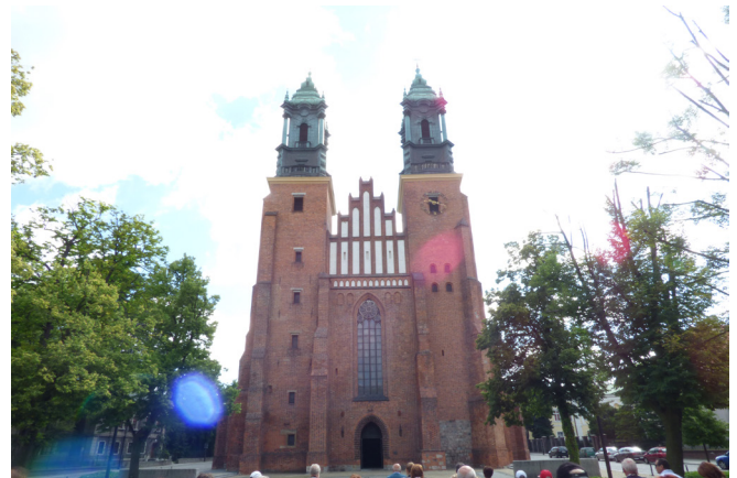
La asociación se dirige a la entrada de la Catedral.

Enfrente de la catedral a 50 metros está la iglesia de la Virgen María, Kosciol Najswietzszej Marii Panny , construida en ladrillo del siglo XV, en estilo gótico, debajo de ella se encuentran las excavaciones del palacio que se supone fue la primera sede del Estado polaco. Pasamos delante de ella, pero no nos detenemos, vamos directamente a la catedral.