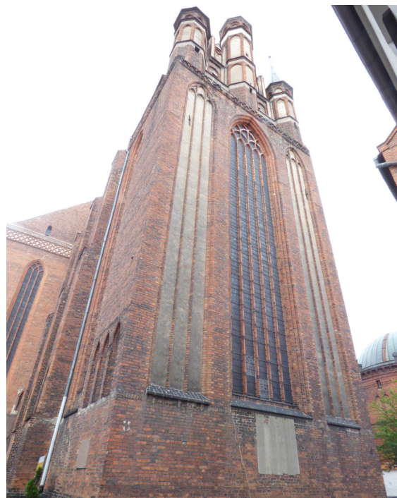
Iglesia de Santa María

El autobús nos deja en la misma puerta de la Muralla, frente al río Vístula, se comenzaron a construir en el siglo XIII, se ampliaron en los siglos XIV y XV, se han conservado las puertas de la ciudad y varias torres de vigilancia del lado del río, además de varios lienzos de muralla; lo primero que observamos al pasar la puerta de la muralla es un edificio de cuatro plantas con muchos vanos, del tamaño de ventanas, son graneros medievales y de época moderna, continuamos hacia la Plaza Vieja del Mercado, buscamos las iglesias góticas: la Catedral Basílica de san Juan Bautista y San Juan Evangelista, construida en el siglo XIV, destacan varias esculturas y pinturas, varios epitafios (entre ellos el de Nicolás Copérnico de 1580) y altares renacentistas y barrocos. Púlpito en la nave central y excelente órgano, cuenta con magníficas vidrieras.