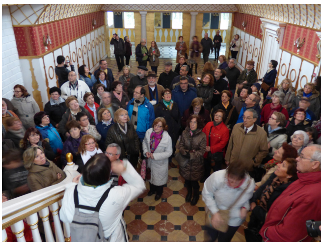
Salón en el Palacio de Moratalla

En el interior, camino de un modernísimo salón de plenos (aunque con unos sillones que son, a ojos de este cronista, resabios de viejos tiempos, destaca el patio con galerías de arcos sobre columnas protegido por unas mamparas de cristal que impiden disfrutar la arquitectura del este rincón municipal.