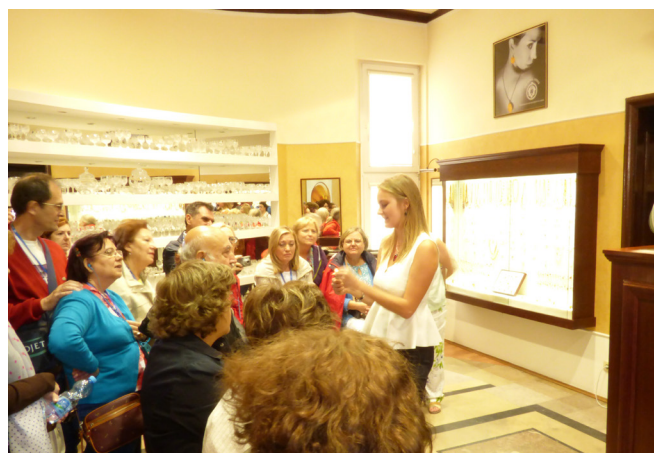
Explicando las propiedades del ámbar

Después del almuerzo terminamos visitando la ciudad y paseando por el puerto deportivo y recreativo, que partiendo de la Gran Noria, nos adentra en el puerto.