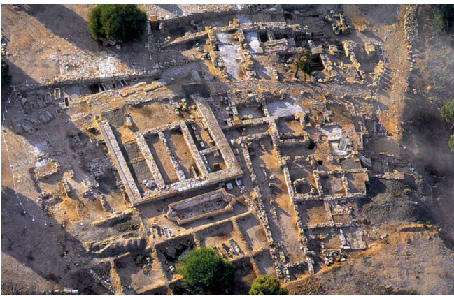
Visa aérea de la domus y templos

Tiene un teatro que aún permanece en su mayor parte bajo tierra, aunque algunas estructuras pueden identificarse a simple vista, según parece su tamaño debe ser mayor que el de otros teatros de la Bética, como pueden ser el de Malaca, Itálica o Baelo. Se conserva la Scaena y dos tercios del graderío.