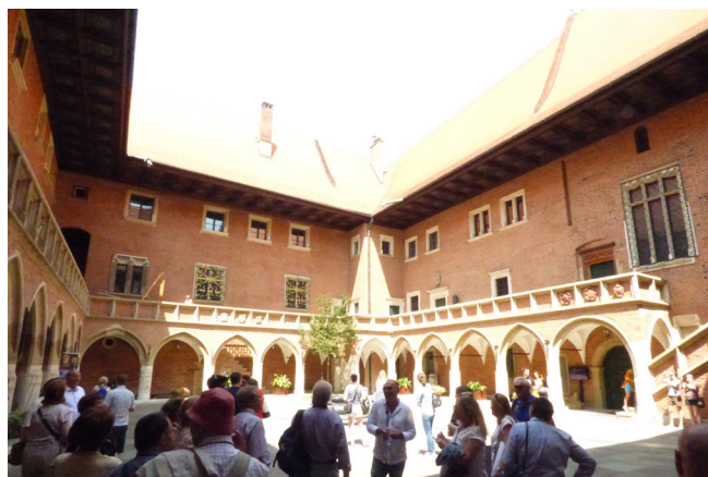
Claustro del Colegio Mayor

El Ayuntamiento es de planta circular, destaca la torre del ayuntamiento construida en 1383 y la basílica de la Asunción de Nuestra Señora, con tres naves y portada con dos torres, cuya construcción se inició en 1360 y que es un magnífico ejemplo del estilo gótico polaco. Hacia el suroeste se encuentran los edificios más antiguos, que pertenecen a la Universidad Jagellónica, fundada por Casimiro III el Grande en 1364.