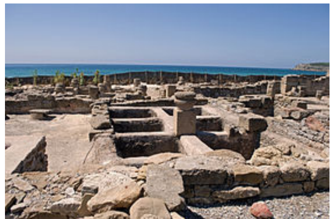
Factoría de salazones

Su mayor esplendor fue entre los siglos I a.C. y II d.C., en la segunda mitad del s.II un maremoto arrasó la ciudad, que sumada a la crisis del s.III, las incursiones de hordas de piratas mauritanos y de germanos, hizo decaer la ciudad. Rebotó a finales del s.III y mantuvo sus relaciones comerciales hasta finales del s. V; fue abandonada definitivamente en el s. VII.