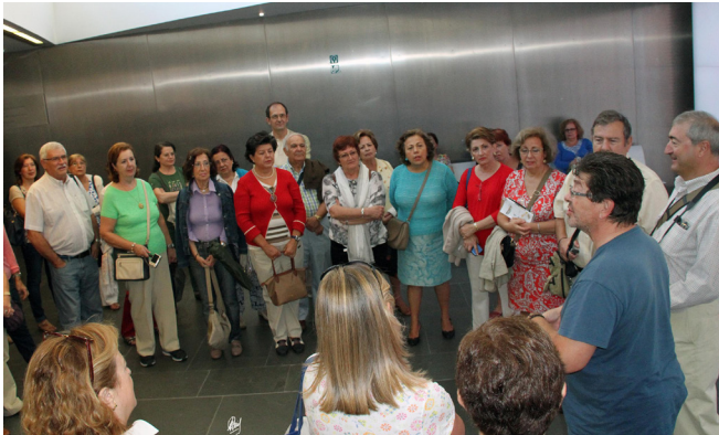
Museo de arqueología submarina Arqua

breve explicación de un guía, pudimos contemplar una réplica exacta de un barco fenicio, único en el mundo, encontrado en la bahía de Mazarrón, dónde todavía permanece y que nos permite conocer las técnicas de construcción naval de estos navegantes, también resultan muy llamativas secciones de barcos, adosadas a la pared y que muestran la tipología y los cargamentos de distintas culturas: fenicia, griega, cartaginesa, romana y medieval, Asimismo había recreaciones de puertos de estas épocas, multitud de objetos relacionados con la marinería: anclas, sondas, amuletos, lingotes de plomo, cerámicas, ...y lo más llamativo de todo: cientos de monedas de plata y oro; además de los efectos personales y útiles de navegación procedentes del cargamento de Nuestra Señora de las Mercedes, fragata española hundida por los ingleses en 1804 y recuperada por nuestro país en 2012.