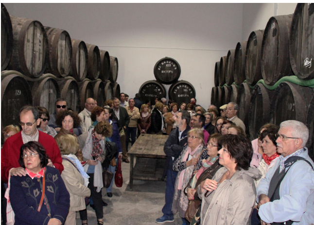
No todo va a ser mantecados

Aquí acabaría esta intensa mañana y tras una copa de vino en una bodeguita local, disfrutamos de un merecido almuerzo en un restaurante llamado, como no podía ser de otra manera en esta ciudad: Don Polvorón. Tampoco podíamos regresar sin antes, y más aún en las fechas en que nos encontramos, tan cercanas a la Navidad, hacer la visita de rigor a alguna fábrica de mantecados. Elegimos La Estepeña y la verdad es que disfrutamos viendo su sistema productivo y admirando una reproducción en chocolate que tenían de mismísimo Manhattan, dónde no faltaban héroes locales como Batman, King Kong, ni Spiderman. La tarde noche terminó en otra fábrica de turrón y como no podía ser de otra manera, en La Despensa de Palacio, culmen de dulces exquisiteces.