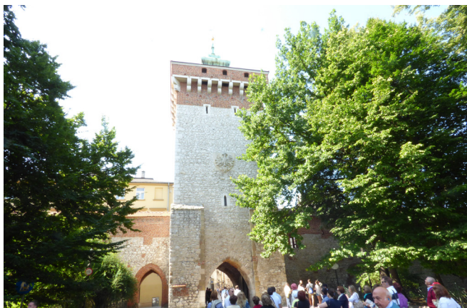
La asociación entra en Cracovia

Aunque fue saqueada por las autoridades alemanas, Cracovia se mantuvo relativamente indemne hasta el final de la guerra, salvándose buena parte de su legado histórico. En 1978 la Unesco añadió por primera vez la ciudad vieja de Cracovia en la lista de sitios declarados Patrimonio de la Humanidad. Está dividido en tres zonas diferenciadas: la colina de Wawel, la ciudad medieval de Cracovia y el núcleo medieval de Kazimierz.