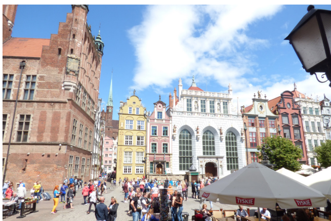
Plaza Ulica Targ

En ella se encuentra la iglesia de Santa María, en su interior hay una excelente pintura del Buen Pastor , en el centro del Altar Mayor se encuentra un cuadro, está representada la Virgen Negra , y en la parte izquierda del crucero, en la pared hay un reloj astronómico , lo hizo Durungers en el siglo XV, indica las horas, los días festivos, las estaciones, etc; el sagrario es de estilo gótico, tiene un pináculo de madera que partiendo del suelo tiene una altura de 8 metros, y encrustada en la pared las primigenias letras del templo. Una tabla del siglo XV, representa los Diez Mandamientos . El órgano es muy vistoso, de mármol, recubierto de jerubines encarnados y figuras decorativas vegetales de colores claros, predomina el color azul. Almorzamos en el restaurante Latajacy Holender (crema de espinacas, ternera stroganoff con pimiento, cebollas, champiñones y puré de patata, de postre tarta de nueces), la cena en el restaurante Gdanski Bowke a las 20 horas.