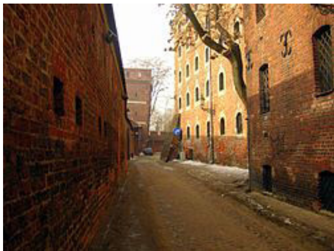
Murallas de la ciudad y torre inclinada

La ciudad de mayoría alemana, adoptó el protestantismo en 1557, teniendo como sede la iglesia de Santa María, mientras los polacos se mantuvieron católicos; en 1595 llegaron los jesuitas para promover la Contra-reforma y tomaron como sede la iglesia de San Juan. Como jesuitas y dominicos controlaban todas las iglesias de Torum a excepción de Santa María, tuvo que ser protegida por milicias de protestantes, para evitar ser ocupada por los católicos, en las fiestas del Corpus Christi de 1682. Como las luchas entre protestantes y católicos continuaron, la Corte Suprema de Varsovia, a instancias de los jesuitas, mandó ejecutar al alcalde de la ciudad y a otros nueve destacados protestantes, mientras tanto los franciscanos se hacían cargo de la iglesia de Santa María, celebrando misa el día de la ejecución el 7 de diciembre de 1724. Este hecho es conocido en toda Europa como “El Tribunal de la Sangre de Torum” . A partir de esta fecha se exige ser católico para adquirir la condición de concejal.