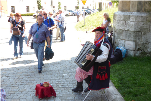
A nuestro paso toca "Que viva España"