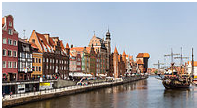
Río Motława a su paso por Gdansk

Malbork está formado por tres secciones diferentes: el castillo alto, medio y bajo, separados por fosos y torres. El castillo llegó a albergar 3000 soldados. Las murallas exteriores del castillo rodean una superficie de 210.000 m 2 , cuatro veces más que el castillo de Windsor. En su interior cuenta con la iglesia de Santa María, varias dependencias agrícolas, patio de armas superior, una gran cocina, varios refectorios, Salón del Gran Maestre de la Orden, un patio enclaustrado con arcaadas góticas, destaca la escultura del Águila Imperial, numerosas celdas para los caballeros, municiones de defensa y ataque (boladros); el castillo está rodeado de un foso y un puente levadizo.