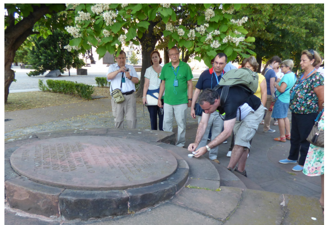
Un polaco haciendo una ofrenda a los judíos.

A la salida del palacio, continuamos la visita por la iglesia de San Martín, la catedral de San Juan, cuyo interior se aprecia una soberbia cúpula con arcos de crucería. Visitamos las murallas de Varsovia, torre barbacana y a 50 metros a extramuros, se encuentra la casa natal de Marie Curie (Maria Sklodowska), volvemos los pasos y nos dirigimos a una gran explanada, donde se encuentra en un lado la Catedral de las Fuerzas Armadas, en el centro de la explanada un monumento a los judíos y otro con ofrendas a la masacre. Junto a ellos se encuentra varias esculturas de soldados juntos, en actitud ofensiva, es el monumento a la Insurrección de Varsovia (que como todos sabemos, fueron los polacos al final de la guerra masacrados por los alemanes, estando los rusos a un kilómetro, al otro lado del río y no intervinieron).