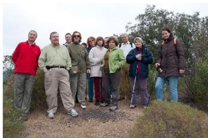
Fotografía del grupo de asistentes en el entorno del puerto Artafi.

Comenzamos la actividad en el entorno del puerto Artafi, en donde la frondosidad de la maleza acumulada