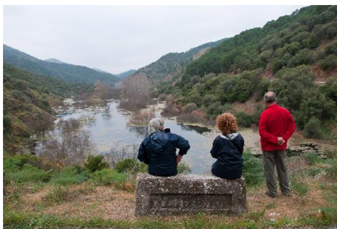
El río Guadiato en las inmediaciones del puente de los Boquerones.

Avanzando en dirección al puente de los Boquerones, desde un promontorio que se alzaba sobre la