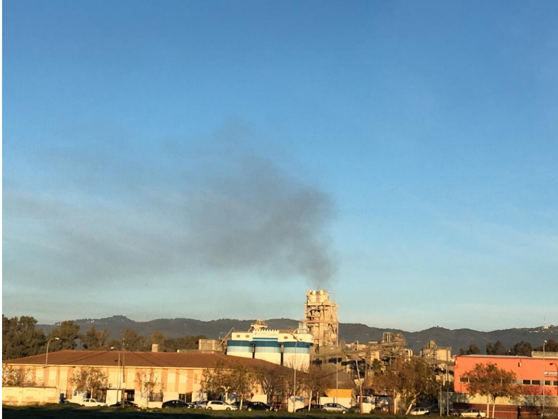
CEIP Concepción Arenal y la Cementera Cosmos (9 de febrero de 2018)