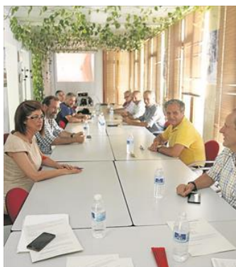
Foto inicio de la reunión