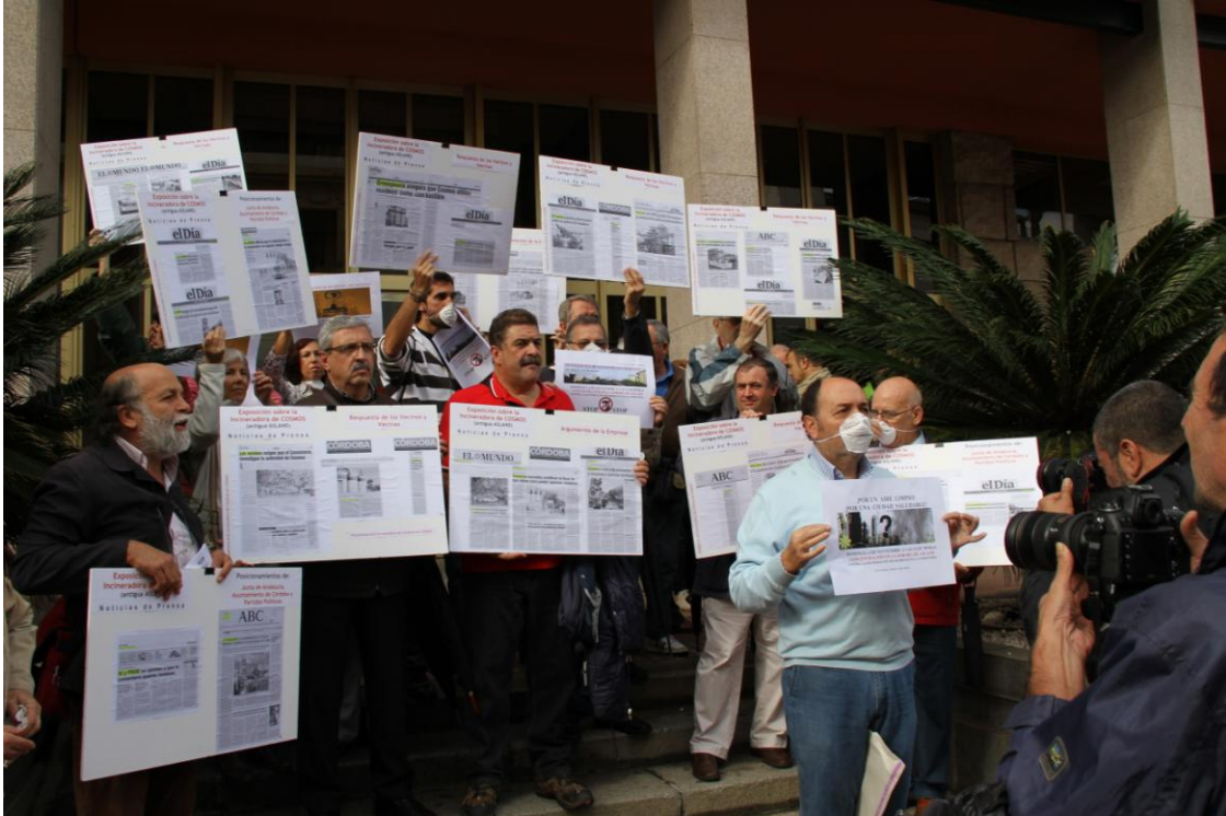
Concentración de la plataforma Córdoba Aire Limpio ante el Ayuntamiento (Foto: J. Padilla, 25 de octubre del 2012)