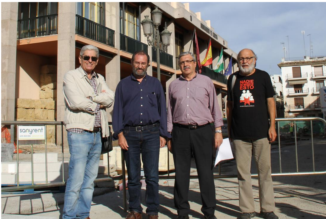
Representantes de las entidades cívicas en la Mesa de diálogo de Cosmos ante el Ayuntamiento (Foto: 26 de octubre del 2016)