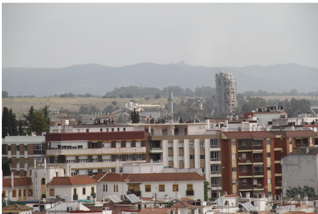
La cementera Cosmos excede en altura a los altos bloques de la Avda. Ollerías. (Foto: J. Padilla, 26, abril de 2017)

En cuanto a la trascendencia o no que esta experiencia participativa tendrá para el éxito o fracaso –por activa o por pasiva, de acción o de omisión–, y su influencia en el proceso que se estaba siguiendo de innovación del PGOU para impedir en el casco urbano la incineración de residuos, aun es muy pronto para poder hacer una valoración, por lo que habrá que dar tiempo para poderlo hacer con precisión y objetividad.