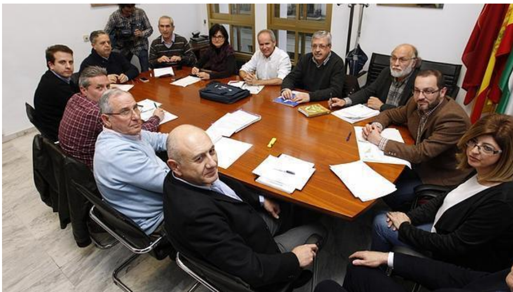
Reunión de constitución de la Mesa de diálogo