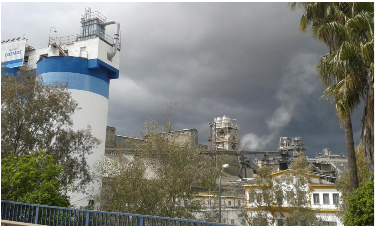
Cementera Cosmos (Foto: David Vázquez, 13 de abril de 2018)

Estaba claro que desde fuerzas ajenas, se quería incidir en la orientación de las conclusiones y llama la atención como dos diarios –especialmente el ABC que no da una puntada sin hilo–, que a lo largo de todo el proceso de lucha contra la incineración de residuos de los colectivos sociales –bien por motivos ideológicos, bien por razones económicas, que de todo hay–, nunca se habían distinguido por su ecuanimidad y falta de rigor en el tratamiento de las informaciones procedentes de o que afectaban a los mismos y si lo hacían, no era para favorecerles, ahora filtraba el contenido de sus conclusiones.