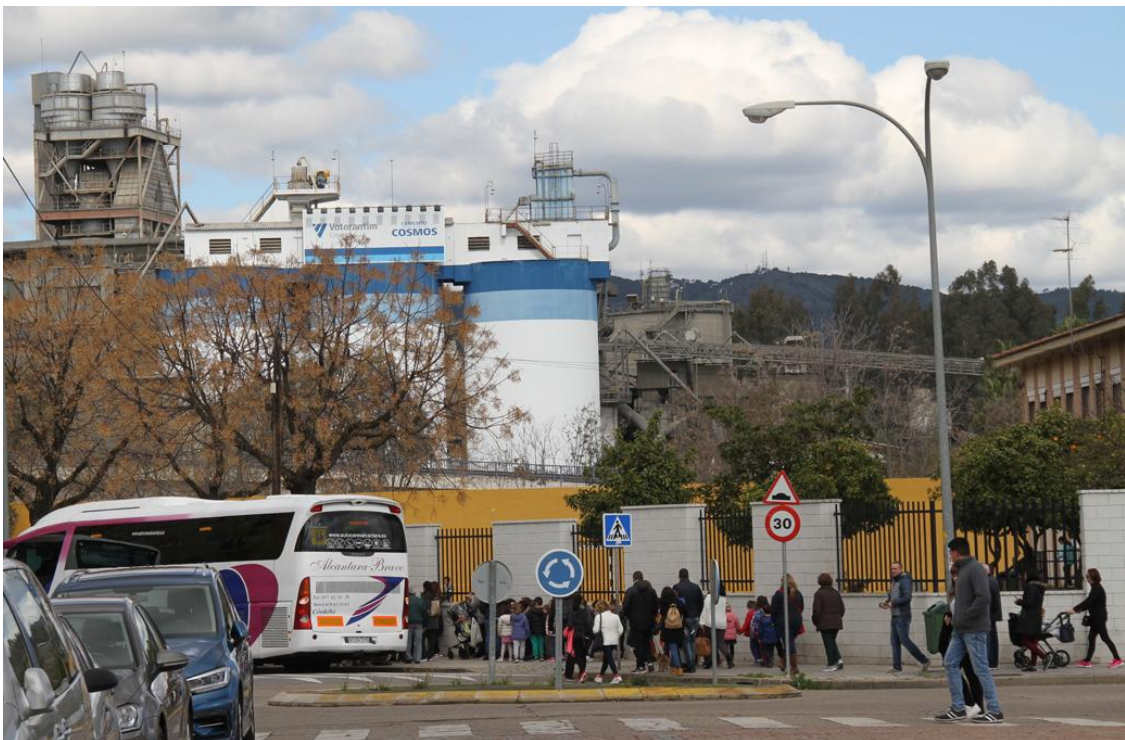
Grupo de niños y padres a las puertas del Colegio Público Concepción Arenal . De telón de fondo la cementera Cosmos (20 de marzo del 2018).

Todos ellos, dejaron constancia de sus intervenciones por escrito y previa a sus intervenciones, se dio a conocer a los miembros de la Mesa esta sencilla presentación histórico-gráfica del impacto de la cementera a lo largo de las décadas en la sociedad cordobesa.