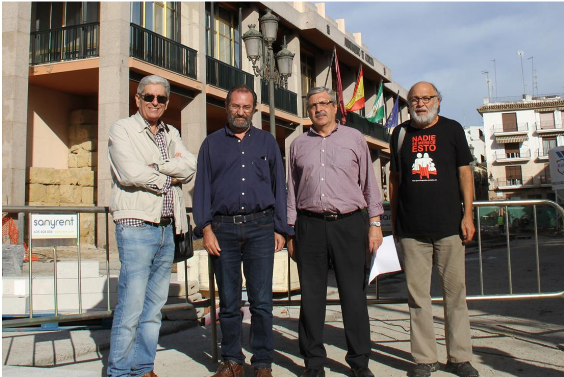
Representantes de las entidades cívicas en la Mesa de diálogo de Cosmos ante el Ayuntamiento (Foto: 26 de octubre del 2016)