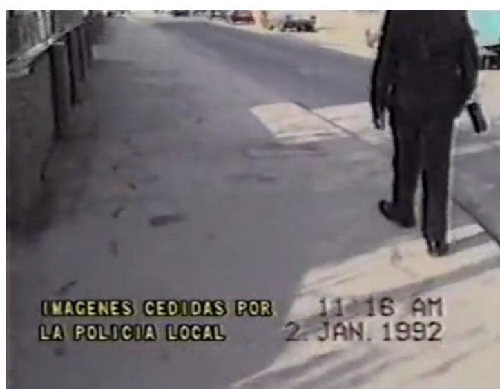
Polígono de Chinales: Imagen del video grabado por la Policía Local sobre las consecuencias del escape de la cementera de 2 de enero de 1992.