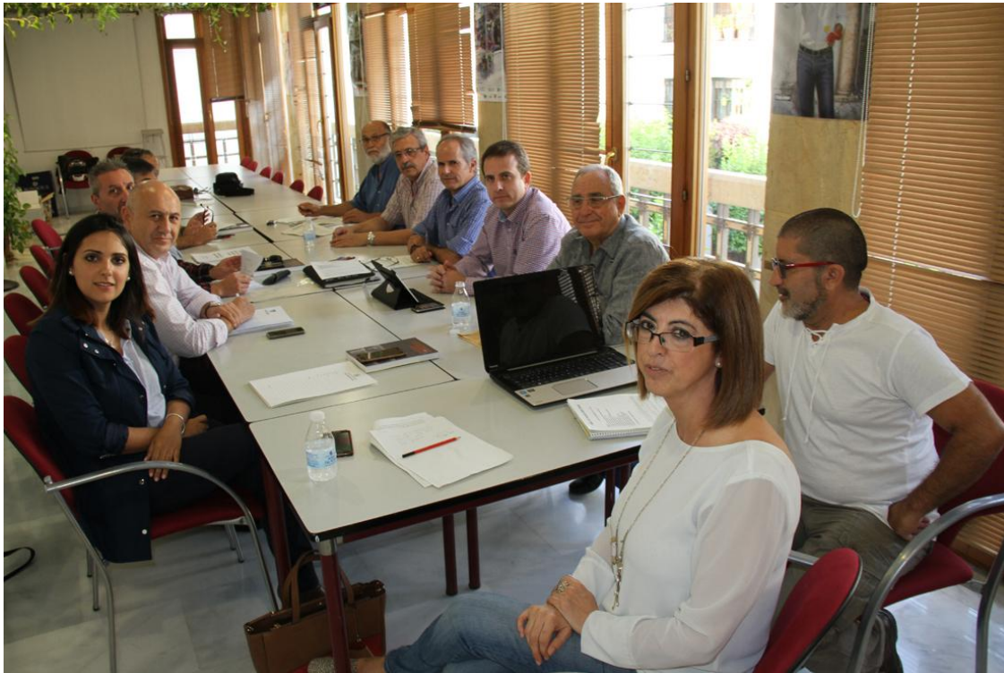
Última sesión de la Mesa de diálogo sobre Cosmos