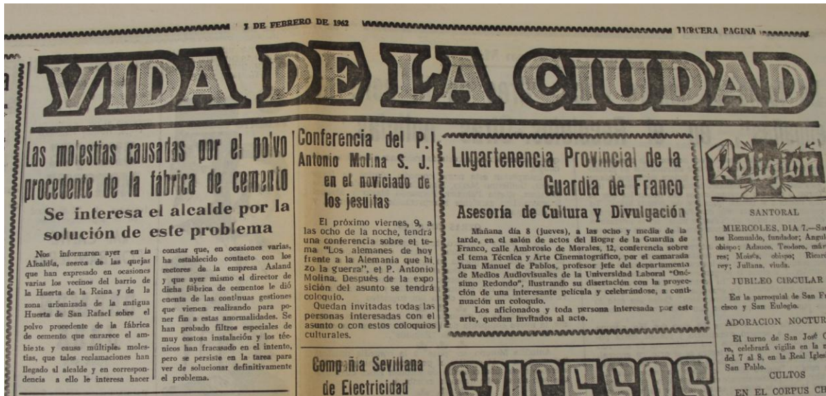
Diario CORDOBA, 7 de febrero de 1962