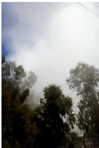
Nuevo incidente en la cementera Cosmos (Foto: Pedro Urbano, 15 de mayo de 2018)

Por supuesto, al Pleno también acudieron con pancartas miembros de la Córdoba Aire Limpio , que en todo momento mantuvieron una corrección no correspondida por aquellos, pues existía el compromiso de rehuir de cualquier enfrentamiento con los trabajadores, actitud de respeto que no fue correspondida por éstos; todo lo contrario, en más de una ocasión buscaron provocaciones que, desde determinados medios de comunicación, daba la impresión, eran alentadas y jaleadas 10 .