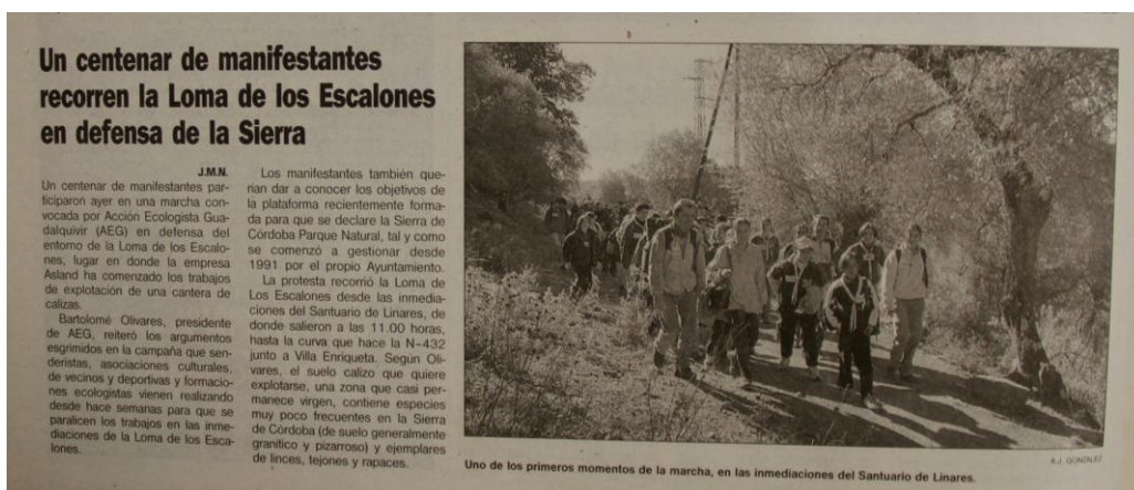
Marcha organizada por Acción Ecologista Guadalquivir en defensa de la Loma de los Escalones el 31 de enero de 1999 (Diario CÓRDOBA , 1 de febrero de 1999)