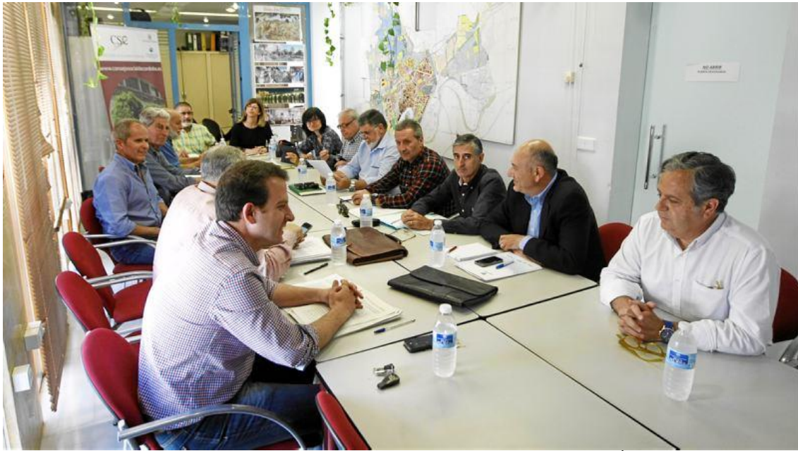
Foto de la reunión

No fue una sorpresa para los representantes vecinales el cambio de parecer del portavoz del grupo municipal de Ciudadanos, pues ya desde hacía tiempo venían sospechando que esta formación política había decidido pasar del compromiso que contrajeron con la firma del Pacto por el Aire Limpio a su oposición, al igual que lo había hecho el Partido Popular.