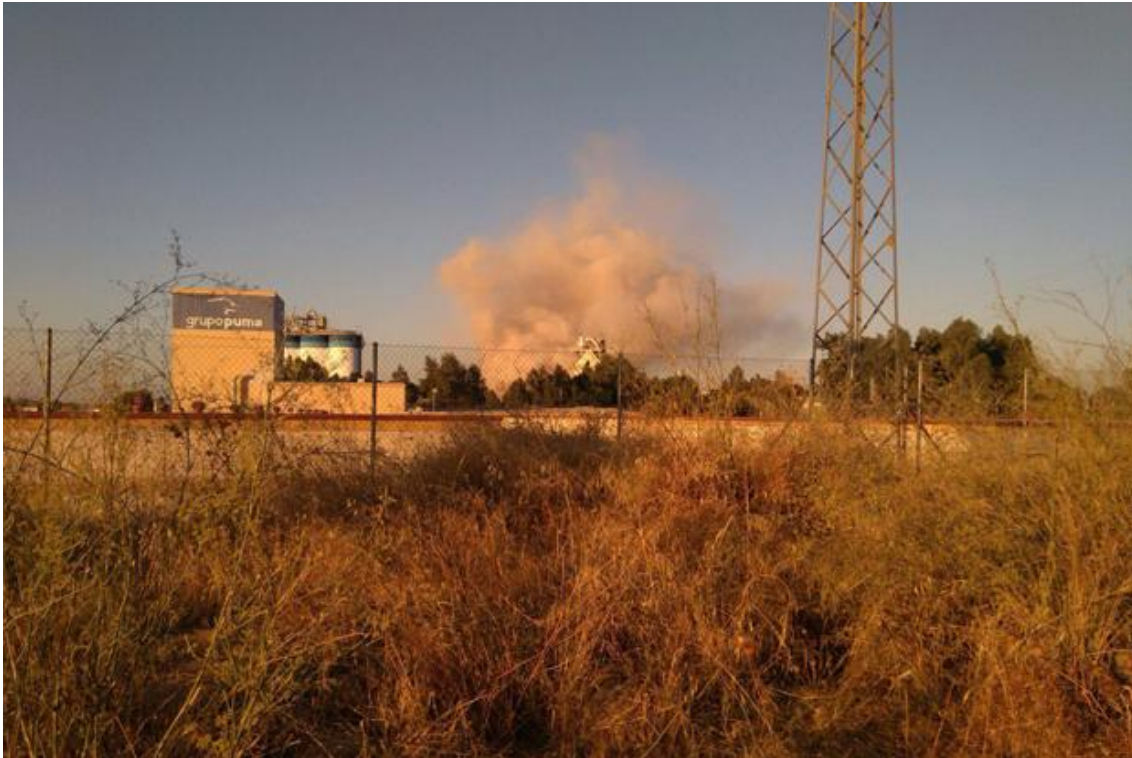
Foto del incidente acaecido en la fábrica de Cementos Cosmos, S. A. publicada en el diario digital CÓRDOPOLIS el 10 de septiembre de 1916.