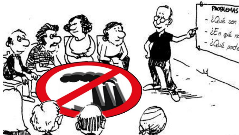
Cartel anunciando una charla informativa de la Plataforma Córdoba Aire Limpio en el Consejo de Distrito Norte el 18 de febrero de 2016.

CENTRO CÍVICO NORTE 18 de febrero a las 19:30