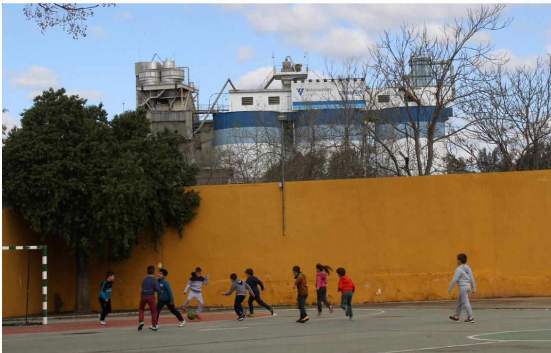
Niños del CEIP Concepción Arenal jugando en el patio de recreo al margen de toda polémica (Foto: J. Padilla, 20 de marzo de 2018)