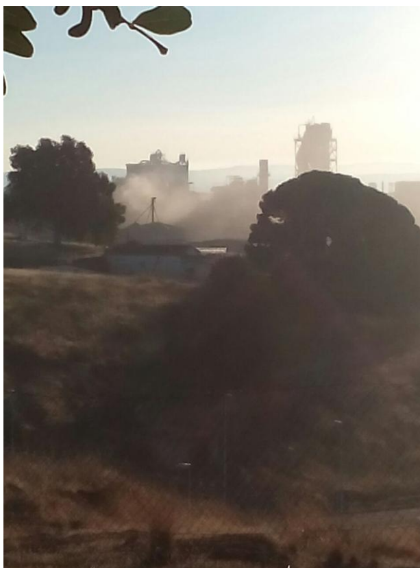
Polución generada por la cementera Cosmos (Foto: 25 de octubre del 2017)

A este respecto no era una cuestión que extrañarse, pues cuando la Plataforma Córdoba Aire Limpio realizaban sesiones informativa o encuentros ciudadanos, siempre aparecía algún o algunos trabajadores de la empresa que no solo intentaban “inquietar” el desarrollo de los actos con sus intervenciones, sino que fotografiaban y grababan discreta y, a veces, no tan discretamente, las intervenciones y al auditorio, siguiendo la conocida técnica de presión social disuasoria y/o de espionaje; por lo que, se presume, Cosmos debe disponer de un amplio dossier informativo sobre los movimientos de la plataforma Aire Limpio y sus promotores.