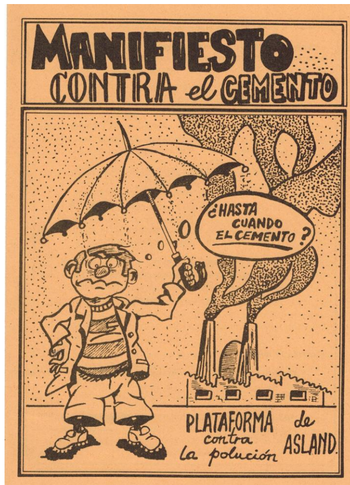
Portada del Manifiesto contra el cemento (Abril, 1992)