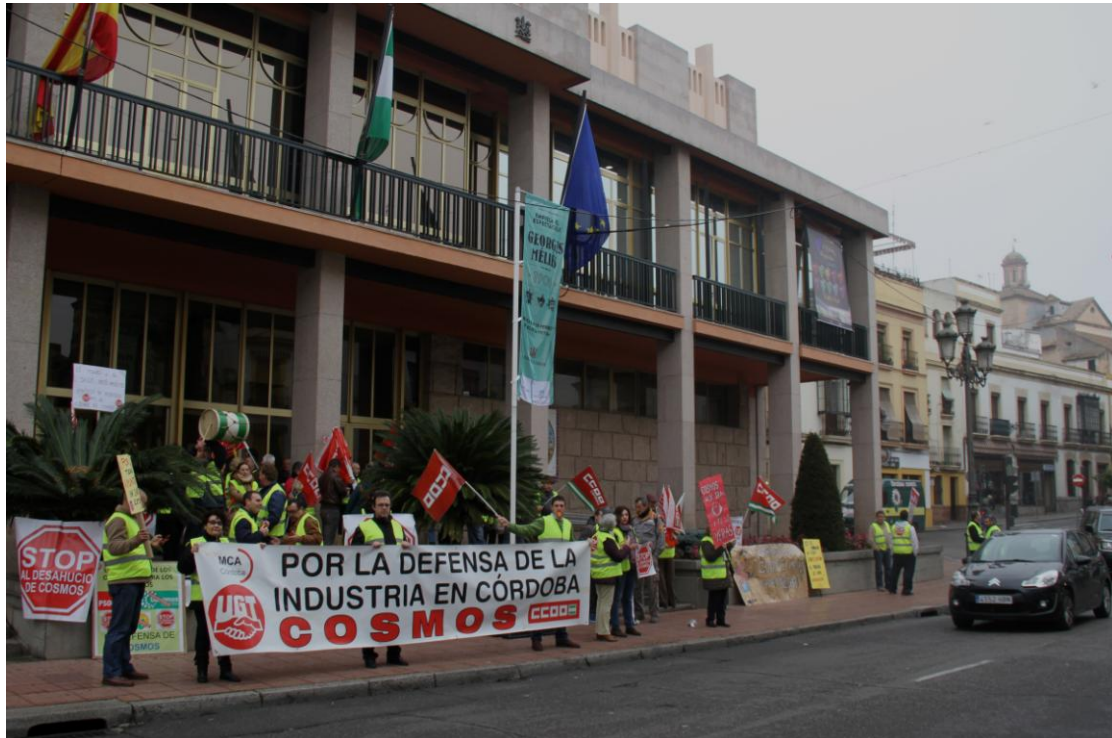
Mientras se desarrollaba el Pleno otro grupo de trabajadores se manifestaban en la puerta del Ayuntamiento (Foto. J. Padilla, 19 de enero del 2016)

En este sentido, me vas a permitir amable lector que haga un inciso ofreciendo como notas que bien pueden reflejar cierto ambiente social que se respiraba contra los defensores de la no-incineración, transcribiendo unas cartas que dirigimos al director del diario ABC de Córdoba, principal medio de comunicación, defensor de la incineración en Cosmos: