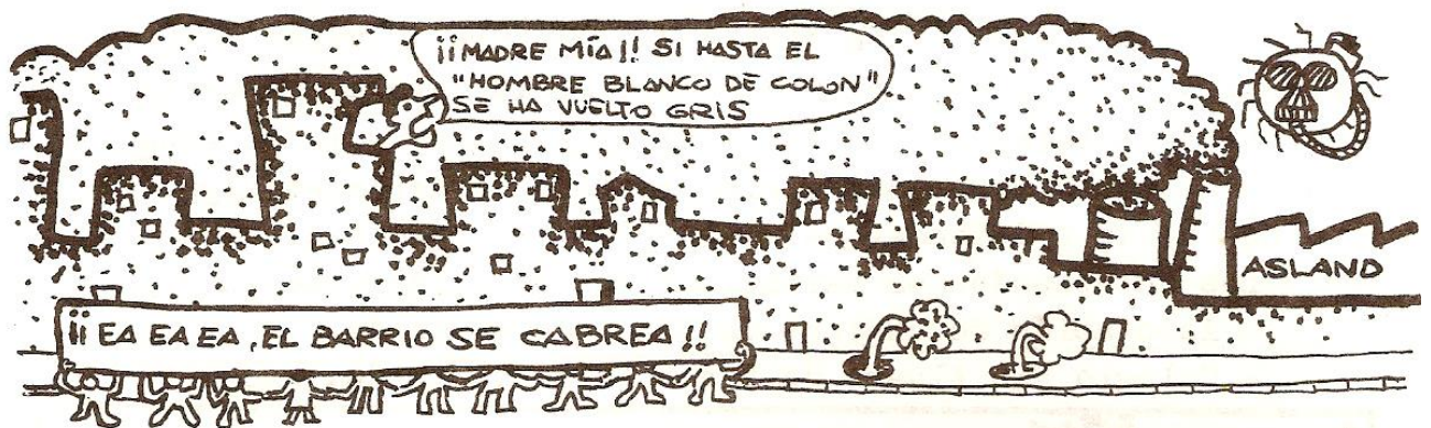
Viñeta publicada en el Boletín Informativo de la A.V. Valdeolleros (Abril 1985)