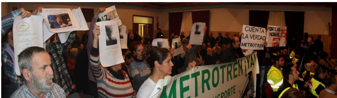
Miembros de la plataforma exhibiendo carteles de denuncia del PP por su traición al Pacto por una Aire Limpio , durante el Pleno (Foto: J. Padilla, 19 de enero de 2016)

El Pleno, como reflejó ampliamente la prensa cordobesa, fue bronco y tenso por diversos motivos, pues en su celebración se mezclaron temas tan diversos como el acuerdo de constitución de la Mesa sobre la cementera, reivindicaciones de la Plataforma del Metrotrén y de aficionados a los toros que temían la aprobación de una moción anti-taurina; aunque, sin duda, la tensión más grave fue creada por los trabajadores, amigos y familiares de la fábrica de cemento, dentro y fuera del Pleno.