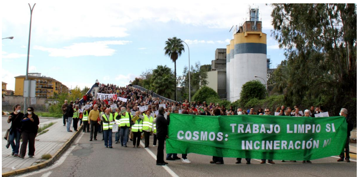
Manifestación de la Plataforma Córdoba Aire Limpio el 11 de noviembre del 2012