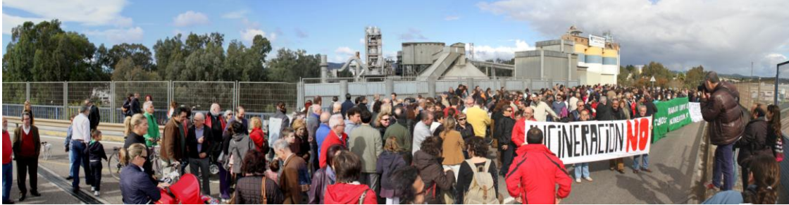
Manifestación contra la incineración de residuos convocada por Córdoba Aire Limpio (Foto: J. Padilla, 11 de noviembre de 2012)