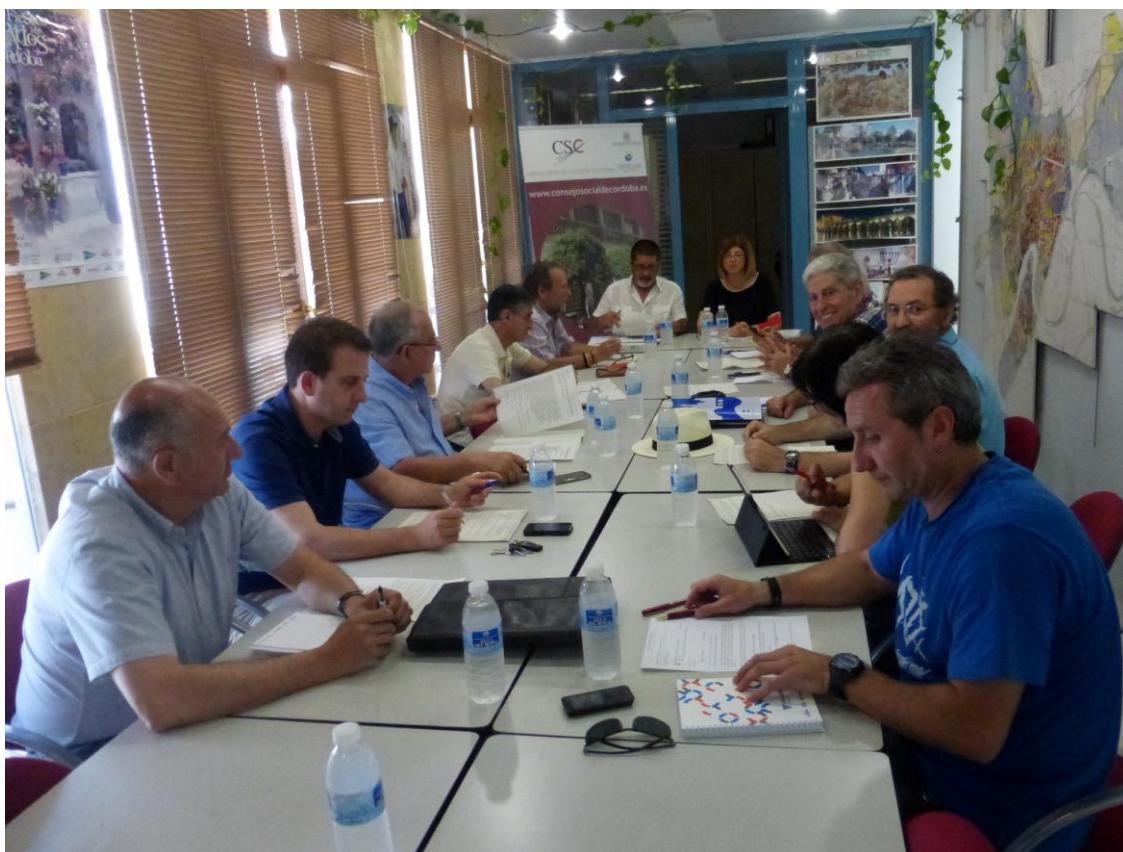
Reunión celebrada por la Mesa de diálogo sobre Cosmos el 7 de junio del 2016