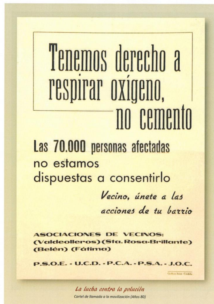
Cartel llamando a la movilización (Enero 1980)