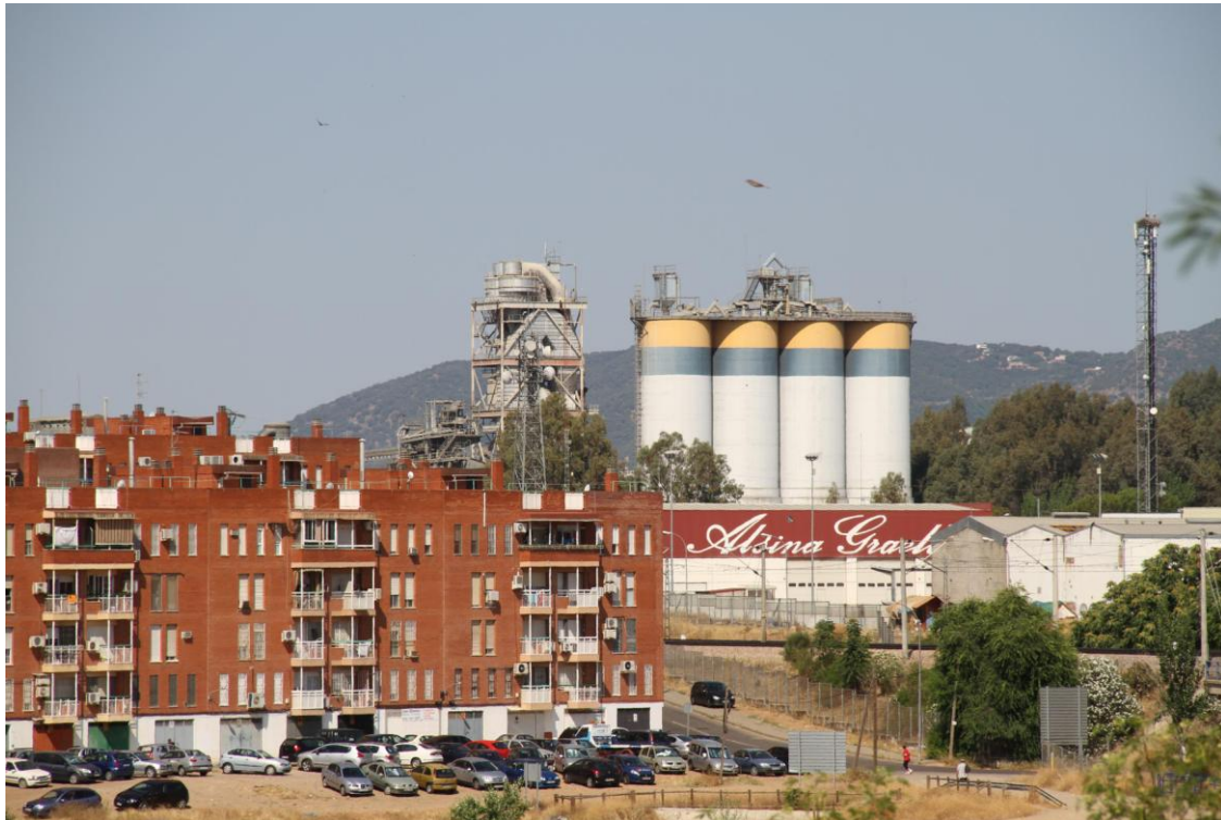
Barriada de Fátima y la cementera Cosmos (21 de junio de 2015)