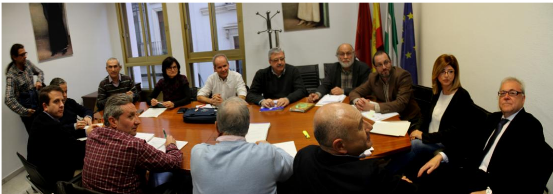
Constitución de la mesa de Mesa de diálogo (Foto: Jesús Padilla, 24 de febrero de 2016)

En conclusión, en esta primera reunión se planteó la metodología, calendario y plazo de reuniones y, sobre todo, la necesaria de claridad, operatividad y confidencialidad, el procedimiento de solicitud de asesoría a diversas instituciones y agentes que se podrían manifestar a través de presentación de informes, y la intención de conseguir puntos comunes de encuentro y consensos precisos para poder hacer llegar al Pleno del Ayuntamiento un acuerdo de mínimos.