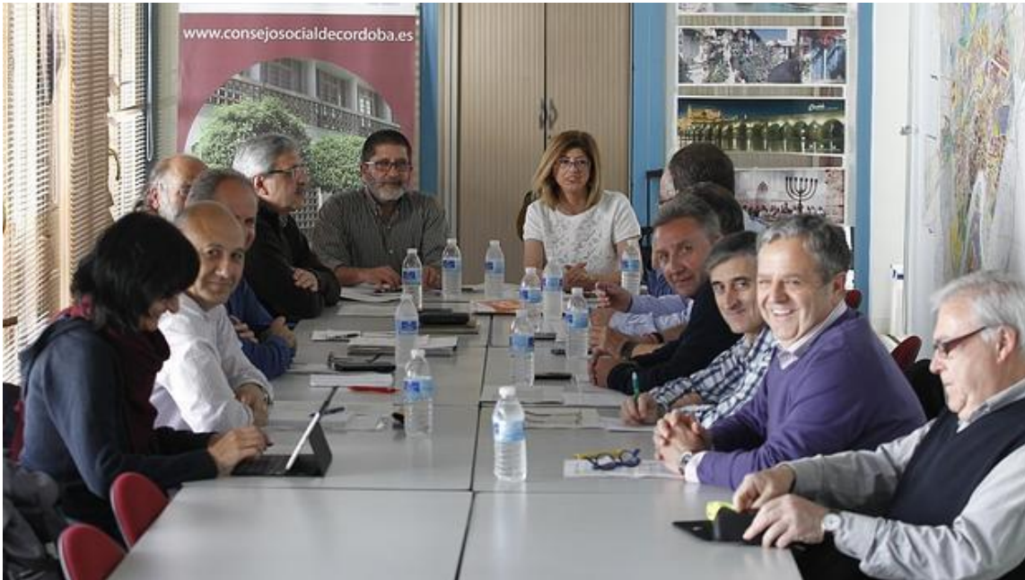
Segunda reunión de la Mesa de diálogo