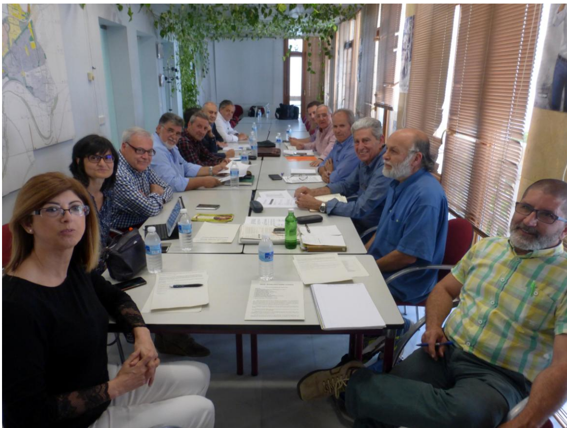
Asistentes a la tercera reunión de la Mesa de diálogo sobre Cosmos (3 de mayo del 2016)