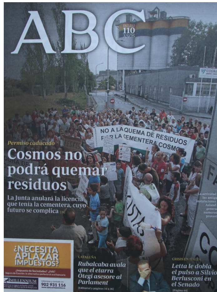
Manifestación a las puertas de Cosmos-Cimpor (Foto: Rafael Carmona, publicada en ABC el 14 septiembre de 2007 y en portada el 3 de octubre del 2013)