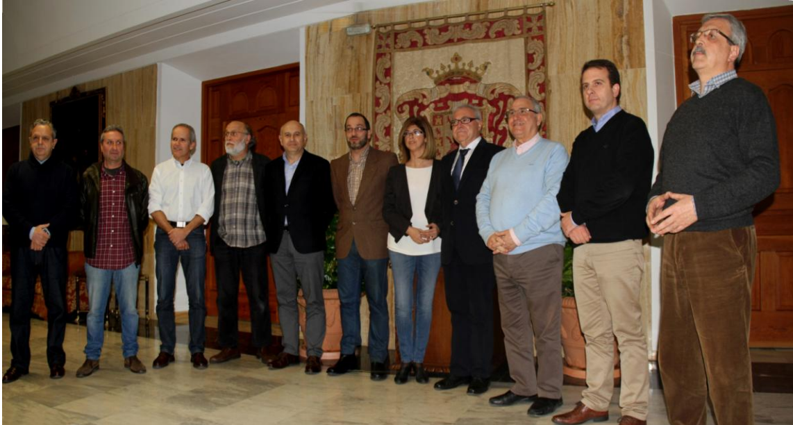
Foto de familia de los miembros de la Mesa de diálogo sobre la cementera Cosmos (Foto: J. Padilla, 24 de febrero de 2016)