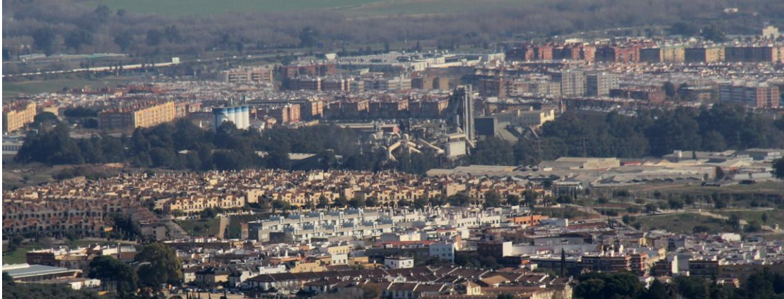
La cementera Cosmos y los barrios de su entorno (Foto: J. Padilla, 3 de febrero de 2018)