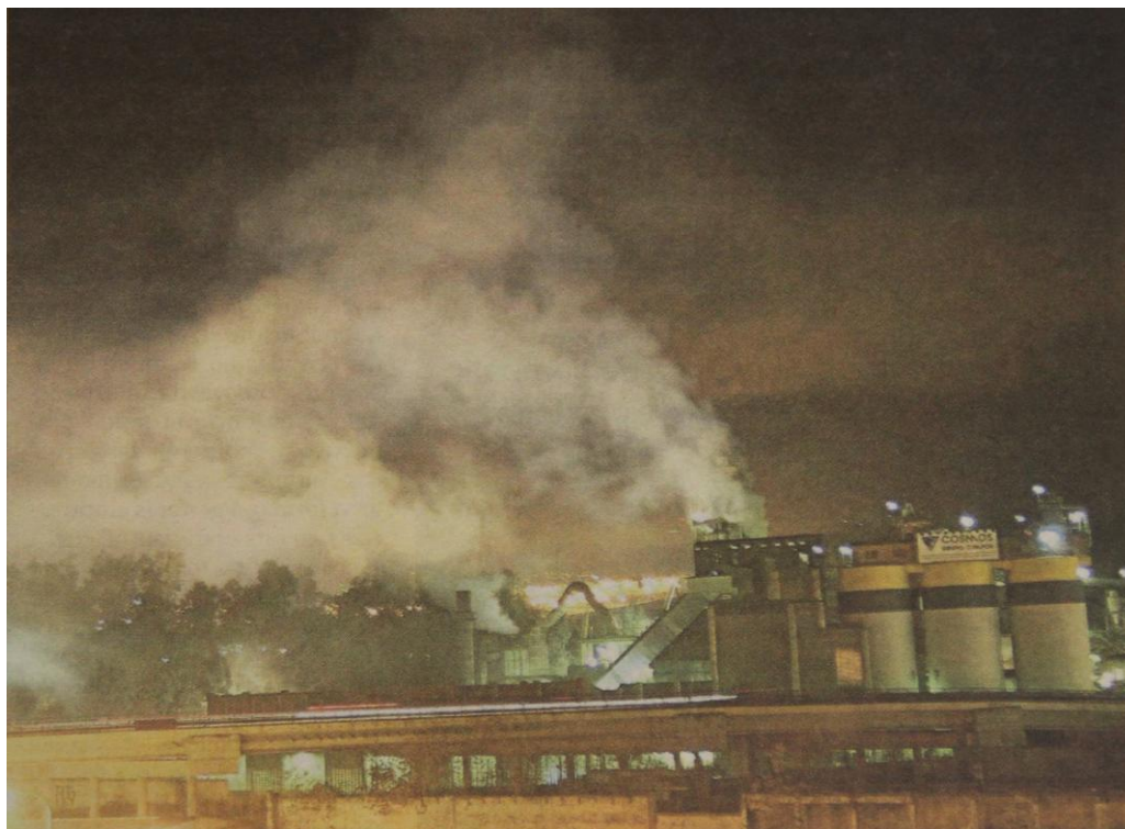
Escape producido en la cementera el 4 de diciembre de 2017