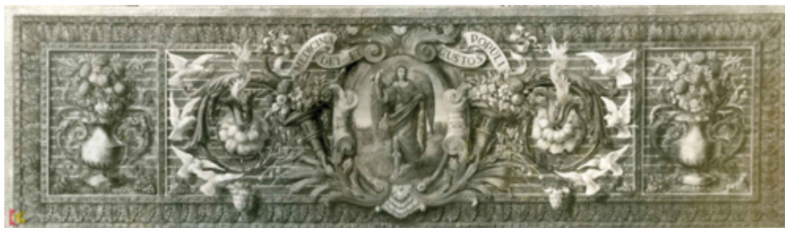
Frontal del altar mayor de la Basílica del Juramento de San Rafael de Córdoba