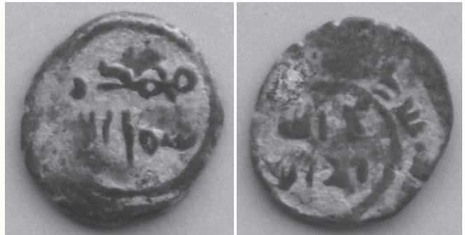
Periodo de Gobernadores. Felús sin fecha, ceca de Al Andalus Peso: 2'5 gr, diámetro: 17 mm, grosor: 1'8 mm.

Una coincidencia interesante es que muchas de estas monedas tienen una estrella, las hispanoárabes en general y éstas en particular. Posiblemente represente a Hesperia, que ya significó para los griegos el astro vespertino que se asocia con los países occidentales y en concreto Hispania. Esa estrella no está ahí por casualidad.