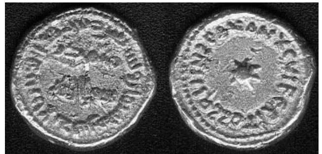
Dinar bilingüe del 98 H. Ceca de Al Andalus-SPAN Colección Tonegawa