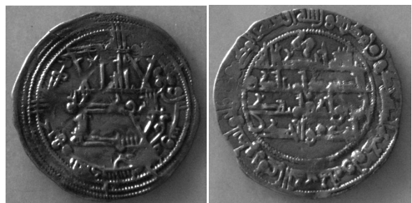
Emirato de Córdoba, Muhammad I, dirham del 261 H. Peso: 2'5 gr, diámetro: 28 mm. Ceca de Al Andalus