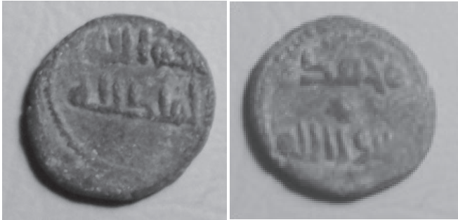
Felús del Periodo de Gobernadores Peso: 3'6 gr, diámetro: 18 mm, grosor: 2'3 mm. Sin ceca ni fecha

A continuación os presento un felús sin ceca ni fecha, aunque su atribución es Al Andalus, y tres feluses de la ceca de Al Andalus.