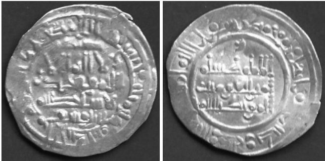
Califato de Córdoba. Hixén II, dirham del 403 H. Peso: 3'6 gr. diámetro: 2'4 mm. Ceca de Al Andalus

Con la guerra civil funcionan las dos cecas, la de Al Andalus y la de Medina Azahara, en función de dónde tuvieran su residencia los participantes en dicha contienda.