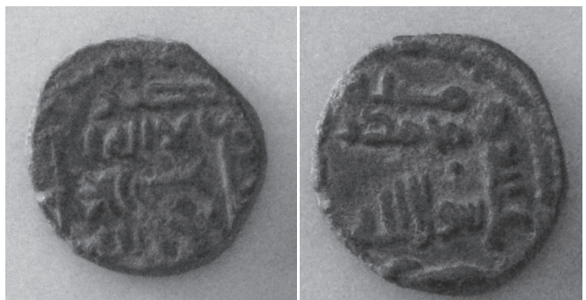
Periodo de Gobernadores. Felús del 110 H, ceca de Al Andalus Peso: 5'6 gramos, diámetro: 19'4, grosor: 3 mm.