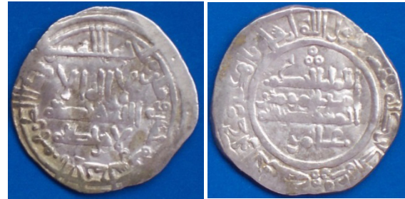
Califato de Córdoba. Al-Hakem II, dirham del 365 H. Peso: 3'5 gr. diámetro: 23'6 mm. Ceca de Al Andalus

“Comenzó en la ceca de Córdoba la acuñación de dirhams grabados con su nombre y tasados según su patrón.....en el año 316 implantó al-Nasir la ceca para acuñar lo que no se había hecho largo tiempo....” (Isa al Razi en el Muqtabis II de Ibn Hayyan).