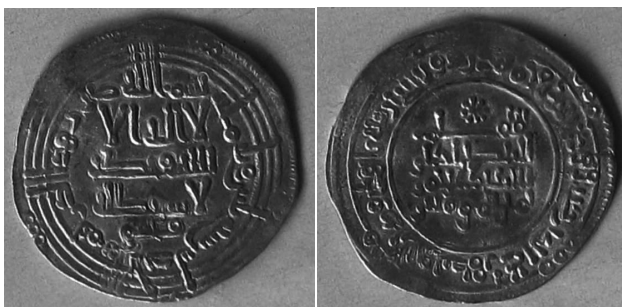
Califato de Córdoba, dirham de Abderramán III del 330 H. Peso: 2'4 gr, diámetro: 25 mm. Ceca de Al Andalus

En el año 330 de la Hégira comienzan las acuñaciones abundantes de Abderramán III, con los dirham llamados qasimíes, nombre con el que se les conoció en todos sitios. Deben su apelativo a la presencia en su anverso de Qasim, el jefe de la ceca.