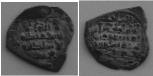
Taifa de Sevilla. Dirham de Abbad Almutadid. Peso: 1'3 gr. Ceca de Al Andalus, 435 H

Pero en otras ocasiones siguieron manteniendo el nombre de Al Andalus, como ocurre en la foto inmediatamente anterior y que corresponde a la taifa de Málaga, ciudad a la que hay que adjudicar en este caso la ceca de Al Andalus. Lo que está claro es que con las taifas va desapareciendo paulativamente el nombre de la ceca de Al Andalus pues pocos de los nuevos Estados se atrevieron a suponer fuesen la metrópoli de los demás.