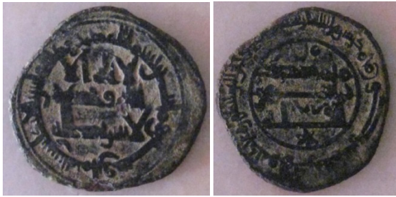
Emirato de Córdoba. Muhammad I, felús del 268 H. Ceca de Al Andalus