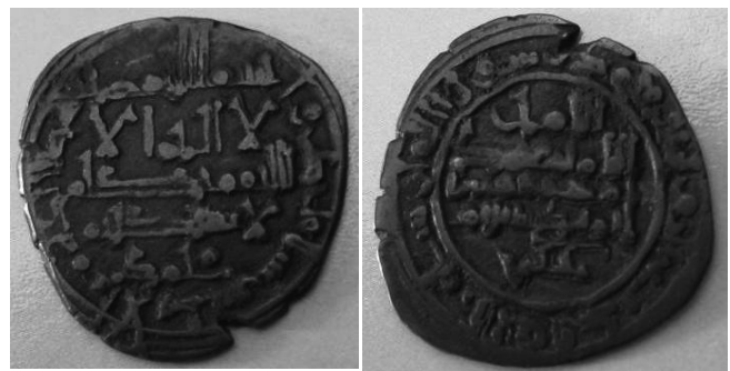
Taifa de Málaga. Dirham de Mohamed Al-Mahdi, 441 H Ceca de Al Andalus

En las fotos que se presentan tenemos un dirham a nombre de Al-Qacim, y en este caso concreto la ceca de Al Andalus se podría localizar en Málaga, Algeciras o Ceuta.