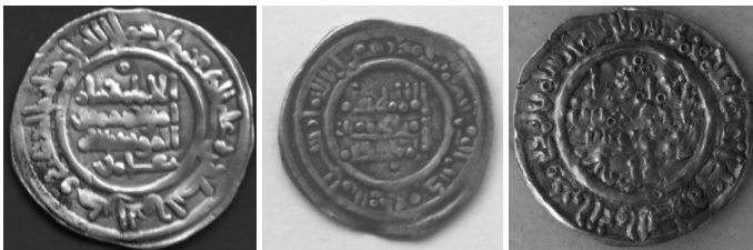
Reversos de tres dirhames de Hixén II del año 388 H. y con ceca Al Andalus, con estilos totalmente distintos

Y es de notar que con Abderramán III a partir del 336 H. y con Al Haquen II hasta el 364 inclusive, la marca de ceca no es Al Andalus sino Medina Azahara cuando, a pesar de estar en esa ciudad, se podía haber seguido con el nombre clásico de Al Andalus al ser la capital del Estado. Hay quien piensa que era para darle más "lustre" a la nueva ciudad.