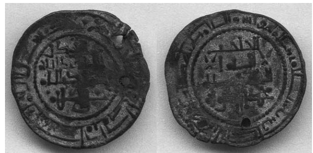
Taifa de Badajoz. Dirham de Umar al-Mutawakil, 460 H. Ceca de Al Andalus. Colección Tonegawa

Se continúa igualmente la acuñación a nombre de Hixén II, y la ceca de Al Andalus que, en este caso, es indudablemente Valencia.