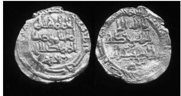
Taifa de Valencia. Dinar de Abd al-Aziz al-Mansur. 428 H Ceca de Al Andalus. Colección Tonegawa

Todas las monedas de Almutadid tienen de ceca Al Andalus, y casi seguro que corresponde a Sevilla. Los expertos atribuyen al año 435 H. este tipo de letra.