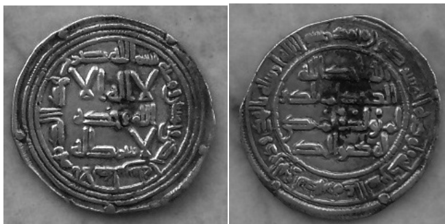
Emirato de Córdoba, Abderraman I, dirham del 151 H. Peso: 2'65 gr, diámetro: 25'7 mm. Ceca de Al Andalus

Este dirham que se fotografía a continuación pertenecería a la 1ª acuñación.