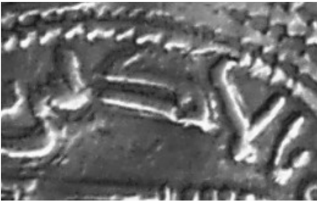
"Al Andalus" en un dirham del 335 H.

Ceca es la casa, oficina o establecimiento donde se acuñaba la moneda árabe. Y es usual que cada ceca utilice una marca que la identifique. Tendríamos así la marca de ceca, que en unas ocasiones es una letra, o una estrella... o el nombre completo de la ciudad en el caso de las acuñaciones musulmanas.