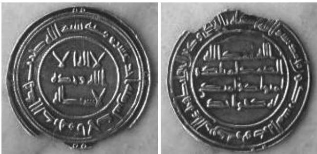
Periodo de Gobernadores. Dirham ceca Al Andalus, año 111 H. Peso: 2'7 gr, diámetro: 27'5 mm.

No se acuñaron en Al Andalus dirhames durante el Periodo de Gobernadores o Waliato, de forma que los que circularon eran de procedencia oriental, del Califato Omeya de Damasco.