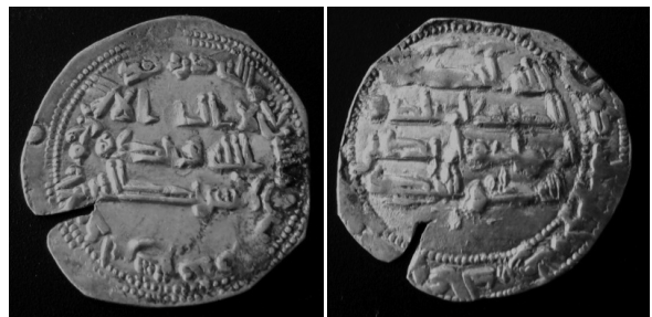
Emirato de Córdoba, Abderramán II, dirham del 233 H. Peso: 2'15 gr, diámetro: 24'28 mm. Ceca de Al Andalus

La ceca se supone en el convento “Salus Infirmorum” hoy dependencias de la Junta de Andalucía.