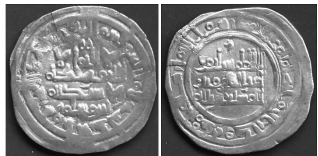
Califato de Córdoba. Dirham de Çuleimán del 400 H. Peso: 3'65 gr. diámetro: 24 mm. Ceca de Al Andalus

En el califato la moneda fraccionaria era inexistente. Se conseguía fraccionando los dirhames. En este caso quedó intacta la marca de ceca de Al Andalus, lo que unido a otros elementos conservados permite identificar plenamente el dirham al que pertenecía.