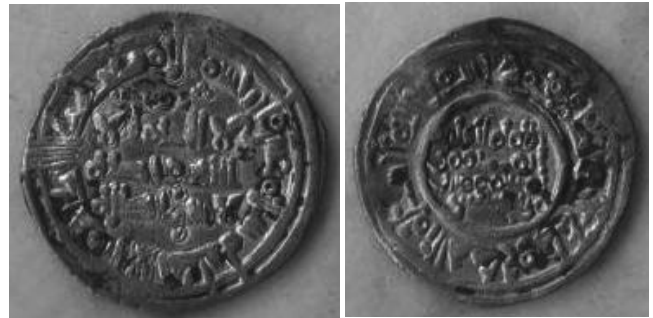
Califato Hammudí. Dirham de Al-Qacim, 410 H Ceca de Al Andalus

Suprimido el Califato Omeya de Córdoba y hasta la invasión almorávide se suceden el Califato Hammudí y las Taifas califales. En ambos casos encontramos la ceca de Al Andalus pero ya no se localiza obligatoriamente en Córdoba.