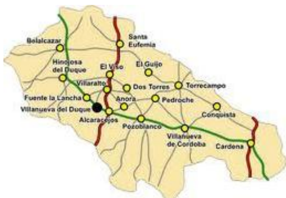
Mapa de la comarca de los Pedroches.

Cronista de Hinojosa del Duque y Licenciado en Historia