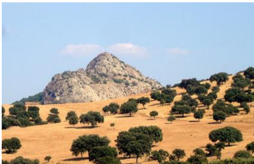
Paisaje de Villanueva del Duque

La relación de empleados que atendían a la burocracia del ayuntamiento se reducía al escribano del Concejo, al correo y a un <<ministro ordinario>>