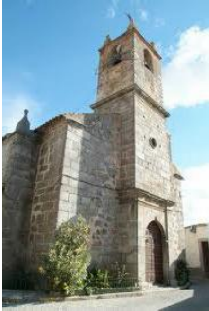
Parroquia de San Mateo de Villanueva del Duque

Los pobres de solemnidad sumaban 16 y una Casa Hospedería daba acogida a los pobres transeúntes.