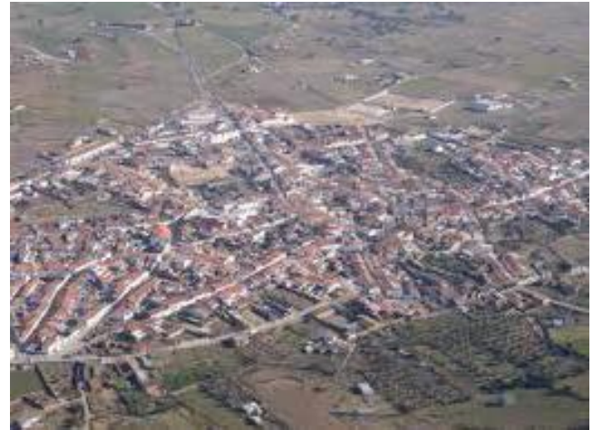
Vista general de Villanueva del Duque

Las villas del condado de Belalcázar –Belalcázar, Fuente la Lancha, Hinojosa del Duque y Villanueva del Duque- formaban la Diezmería de Belalcázar e Hinojosa.