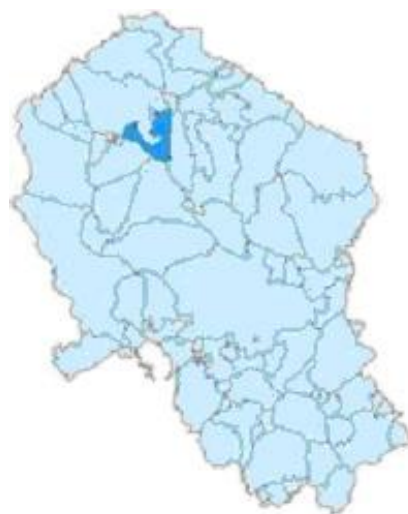
Ubicación de Villanueva en la Provincia de Córdoba

El 31 de marzo de 1753, ante el juez subdelegado de la Real Única Contribución, concurrieron en las Casas Consistoriales el vicario de la Villa, el teniente corregidor, los alcaldes ordinarios, regidores, el síndico procurador común, el alguacil mayor, todos ellos con voz y voto en el Ayuntamiento. Junto con el escribano del Cabildo, tres vecinos, de profesión labradores, como peritos <<por su inteligencia y de conocimiento en el número y calidad de tierras en este término, sus frutos y cultura. Sujetos del Pueblo, sus artes, oficios, ocupación y utilidades y granjería 3 .>>